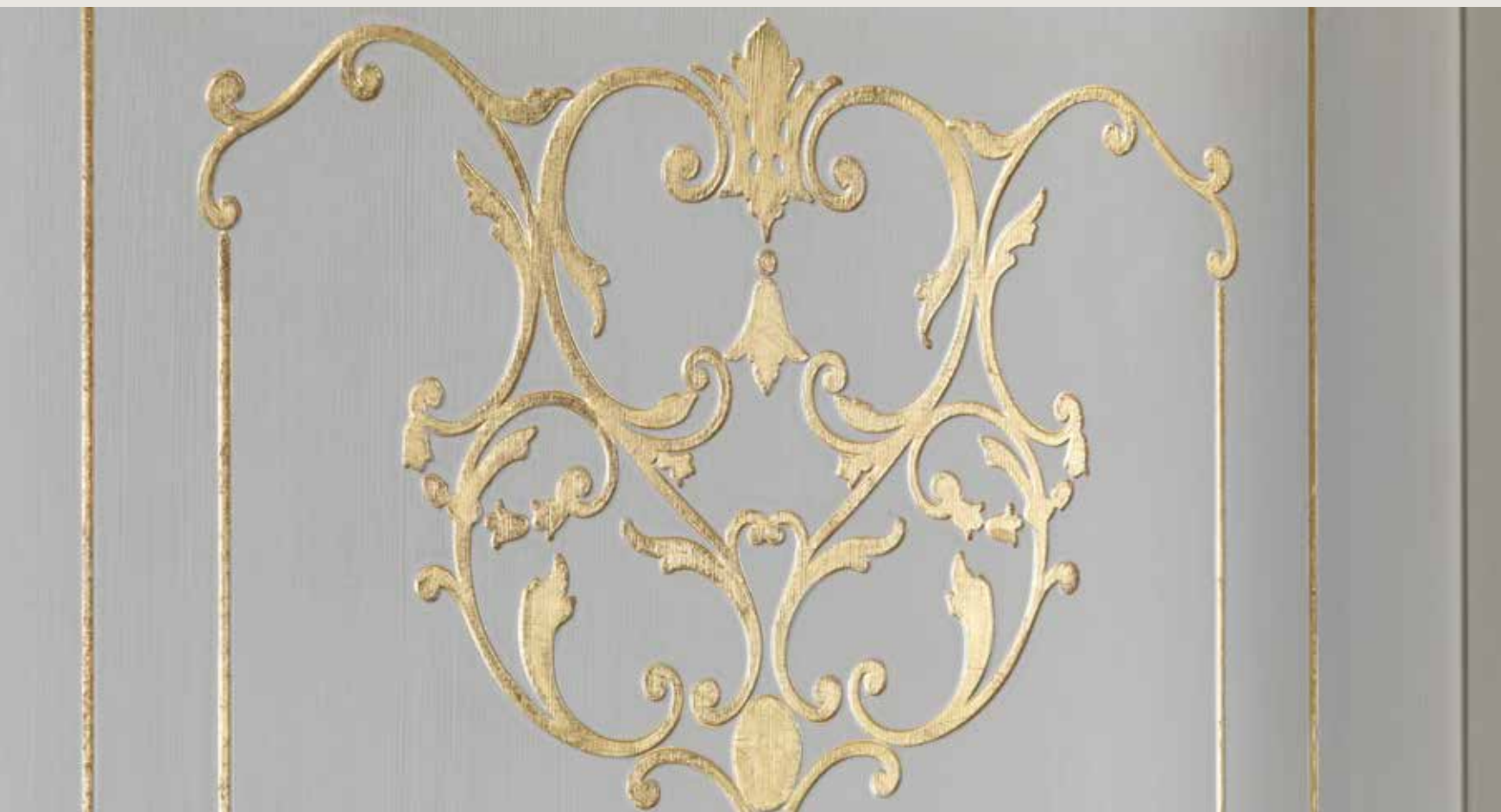
particolare cimasa e decoro oro