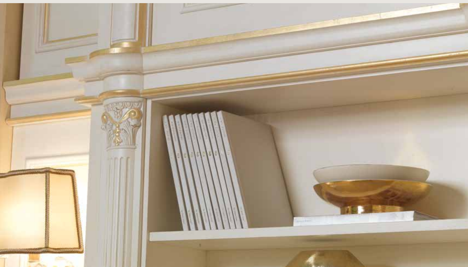
Particolare Parete LUIGI XVI patinato oro sbiancato.