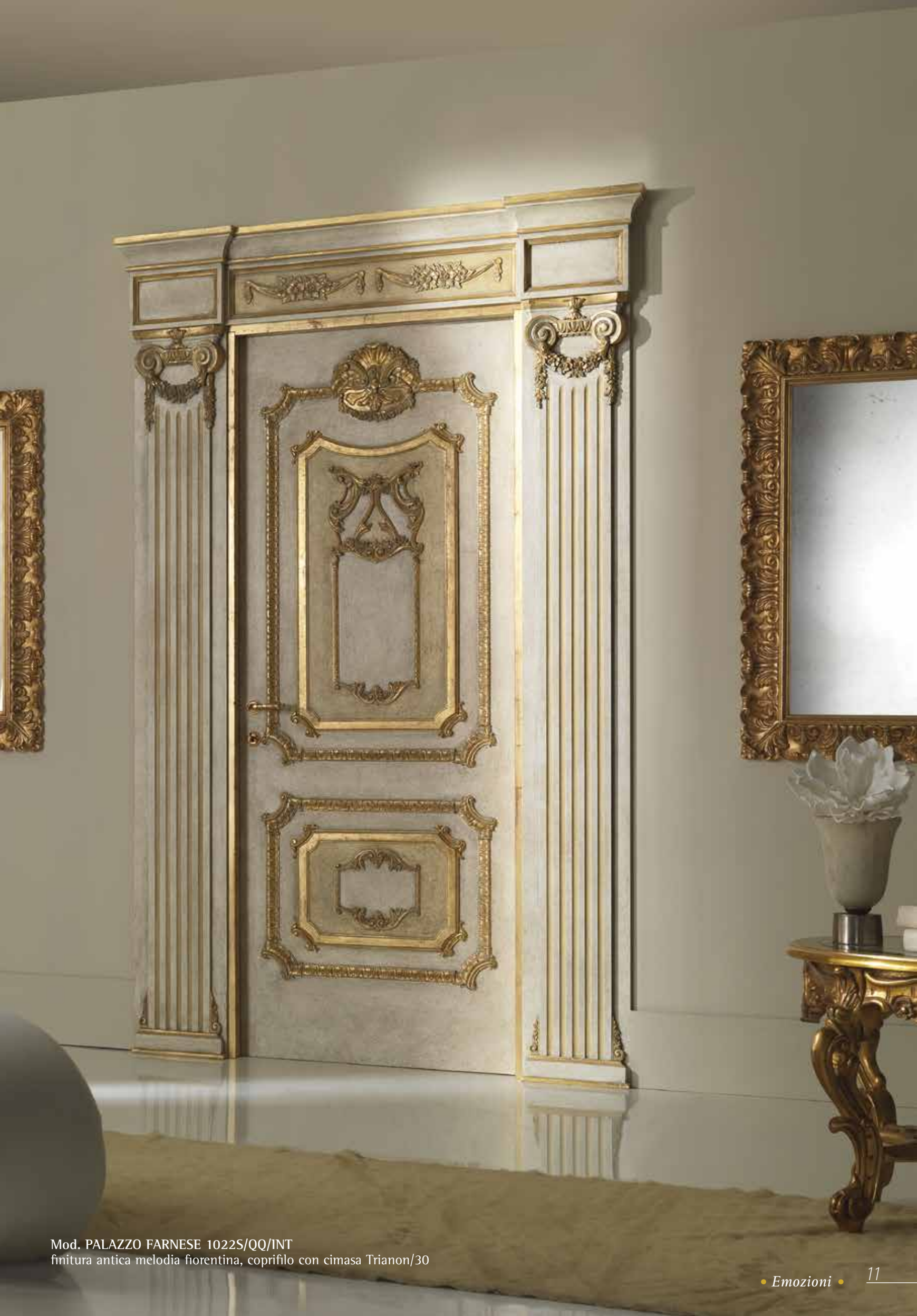
Mod. PALAZZO FARNESE 1022S/QQ/INT finitura antica melodia fiorentina, coprifilo con cimasa Trianon/30