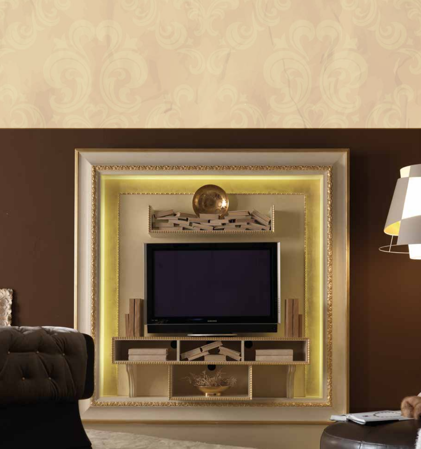
HOME CINEMA finitura patinato spugnato bianco-oro