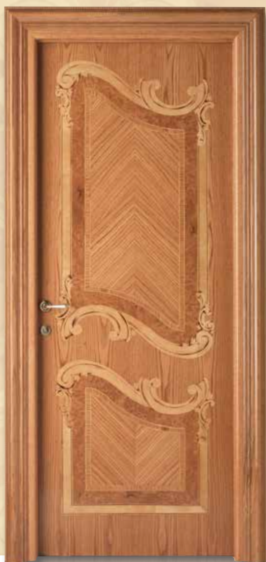
Mod. PALAZZO REALE 1032/QQ/INTAR/P telaio Klee, coprifilo San Pietroburgo rovere finitura maggiolino lucido