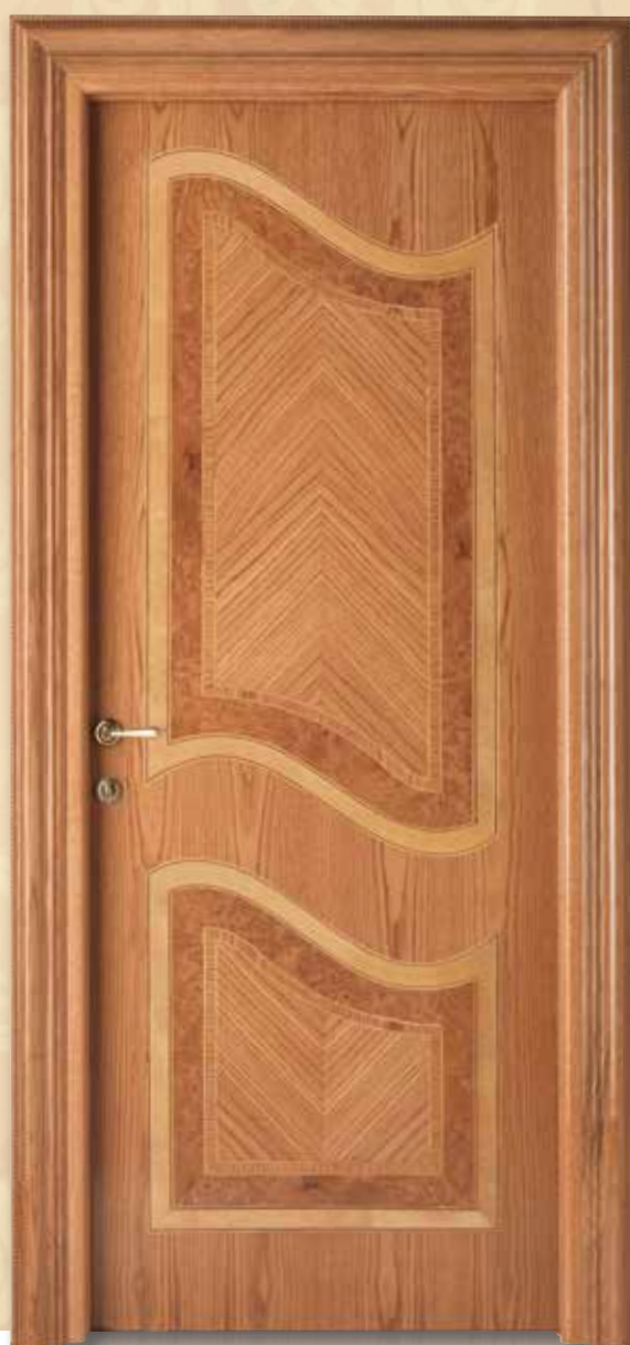
Mod. PALAZZO REALE 1032/QQ/INTAR/S telaio Klee, coprifilo San Pietroburgo, rovere finitura maggiolino lucido