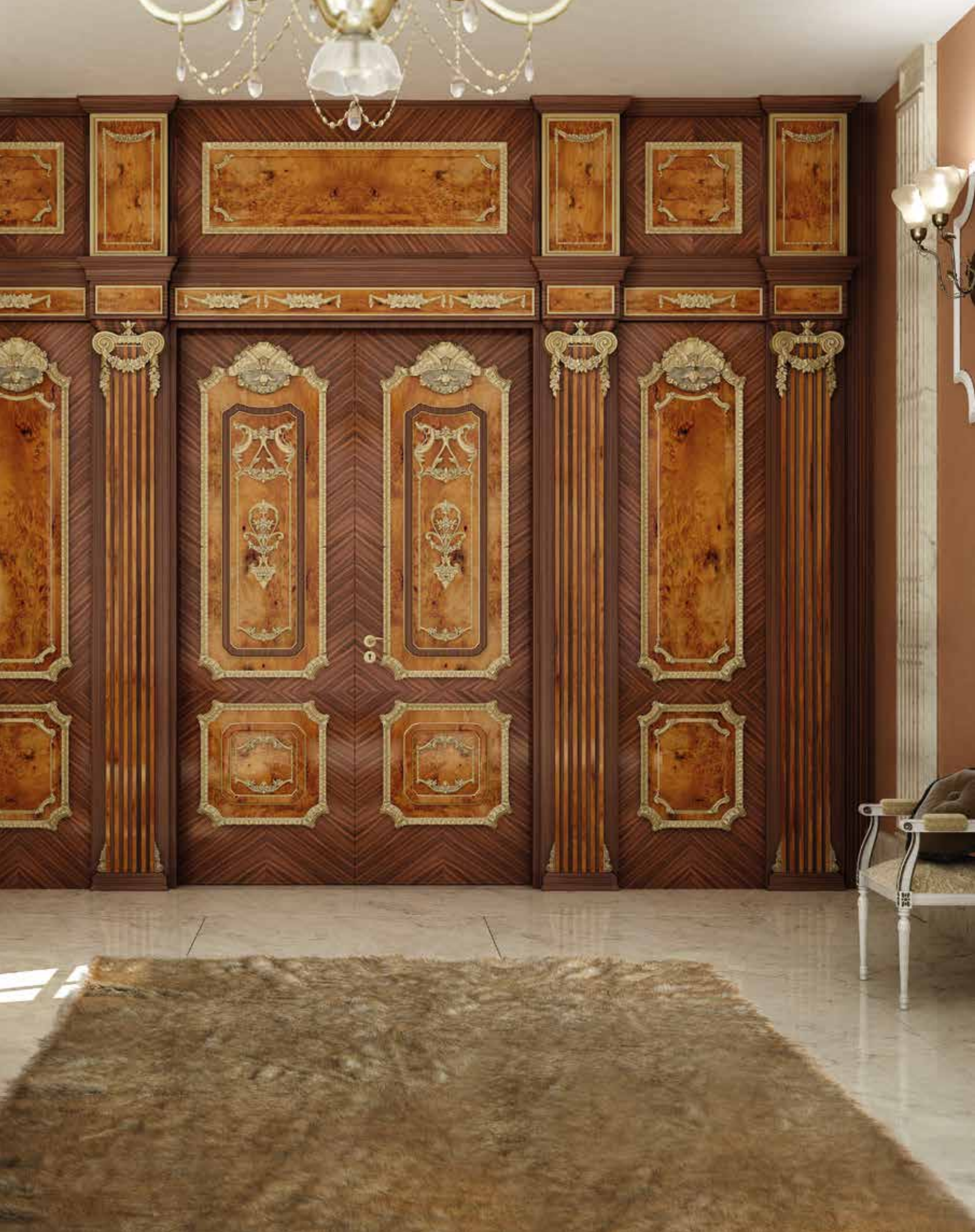
Mod. PALAZZO FARNESE 1022/QQ/INT radica di maples e palissandro spigato coprifilo con cimasa Trianon/30, boiserie di rivestimento parete 1022/QQ