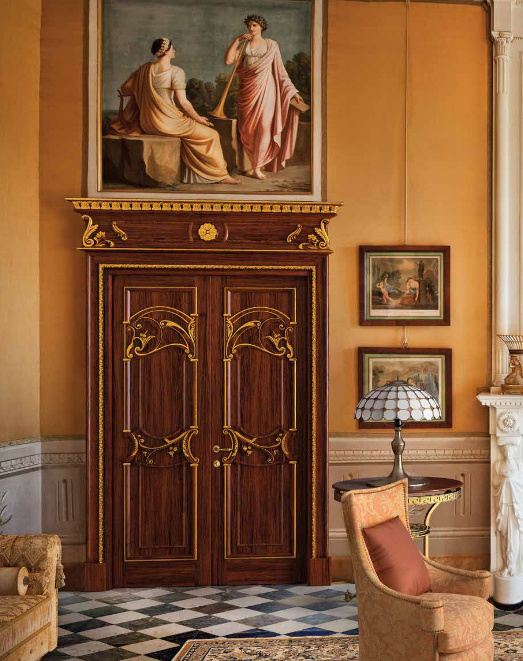
Mod. QUIRINALE 1023/QQ coprifilo con cimasa Quirinale toulipier finitura noce oro antiquariato