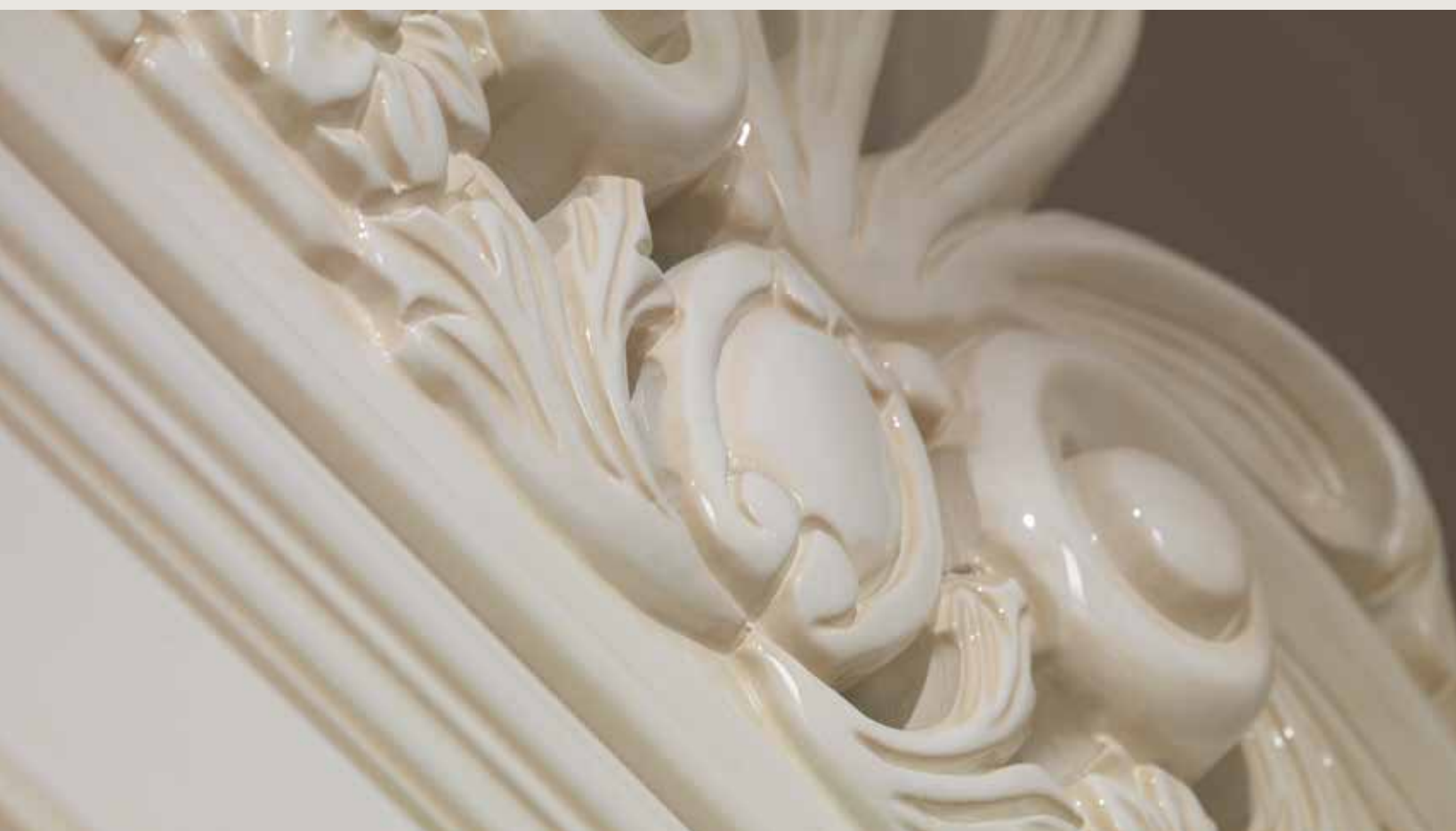
Particolare Mod. PALAZZO REALE laccato patinato lucido 100 gloss