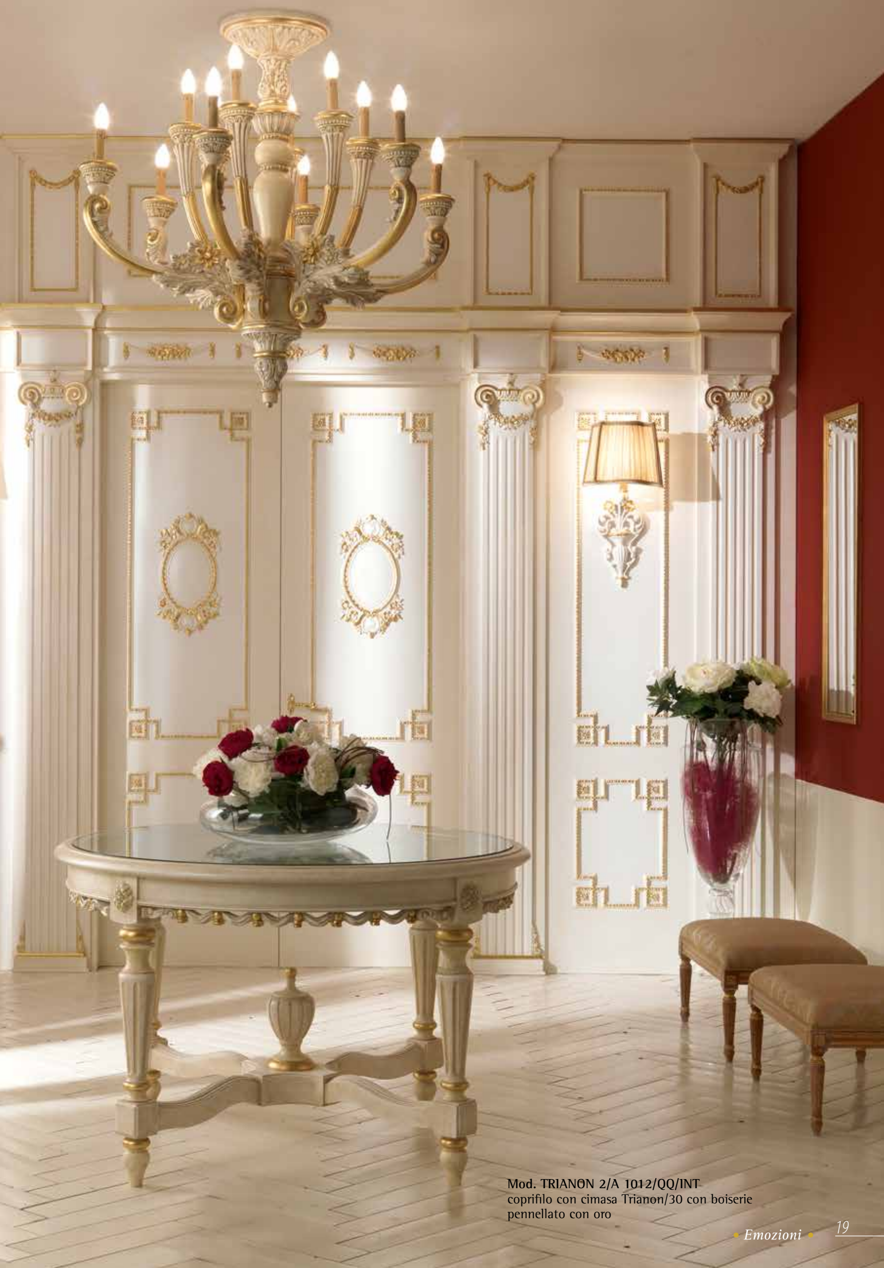
Mod. TRIANON 2/A 1012/QQ/INT coprifilo con cimasa Trianon/30 con boiserie pennellato con oro