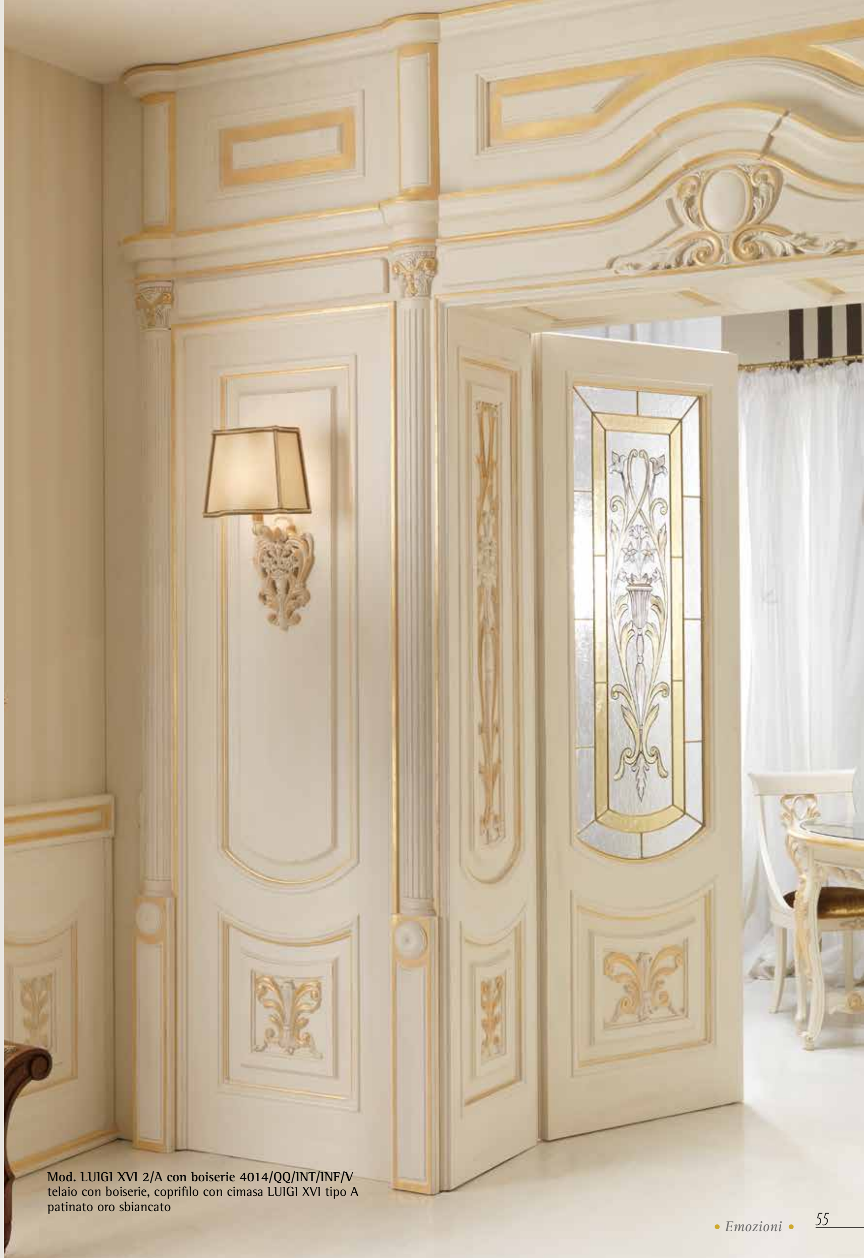
Mod. LUIGI XVI 2/A con boiserie 4014/QQ/INT/INF/V telaio con boiserie, coprifilo con cimasa LUIGI XVI tipo A patinato oro sbiancato