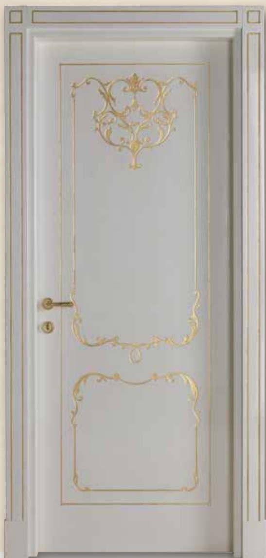
Mod. VILLA TORRIGIANI 5020/QQ coprifilo CF 14 pennellato con oro finitura lucida