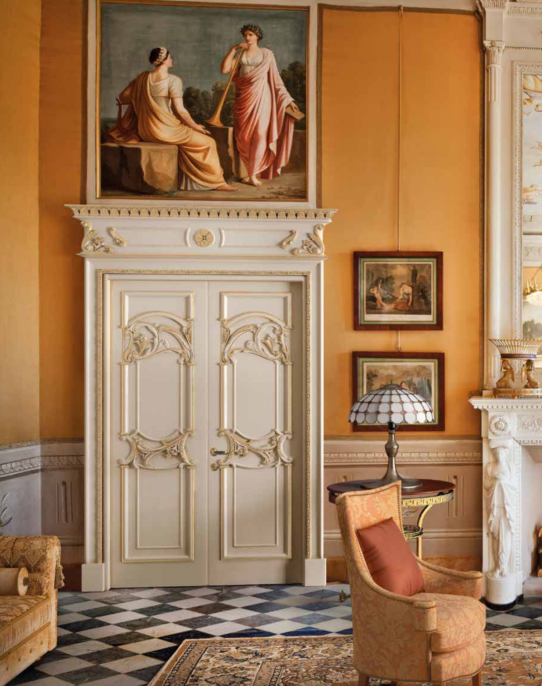
Mod. QUIRINALE 1023/QQ coprifilo con cimasa Quirinale finitura patinato sbiancato oro