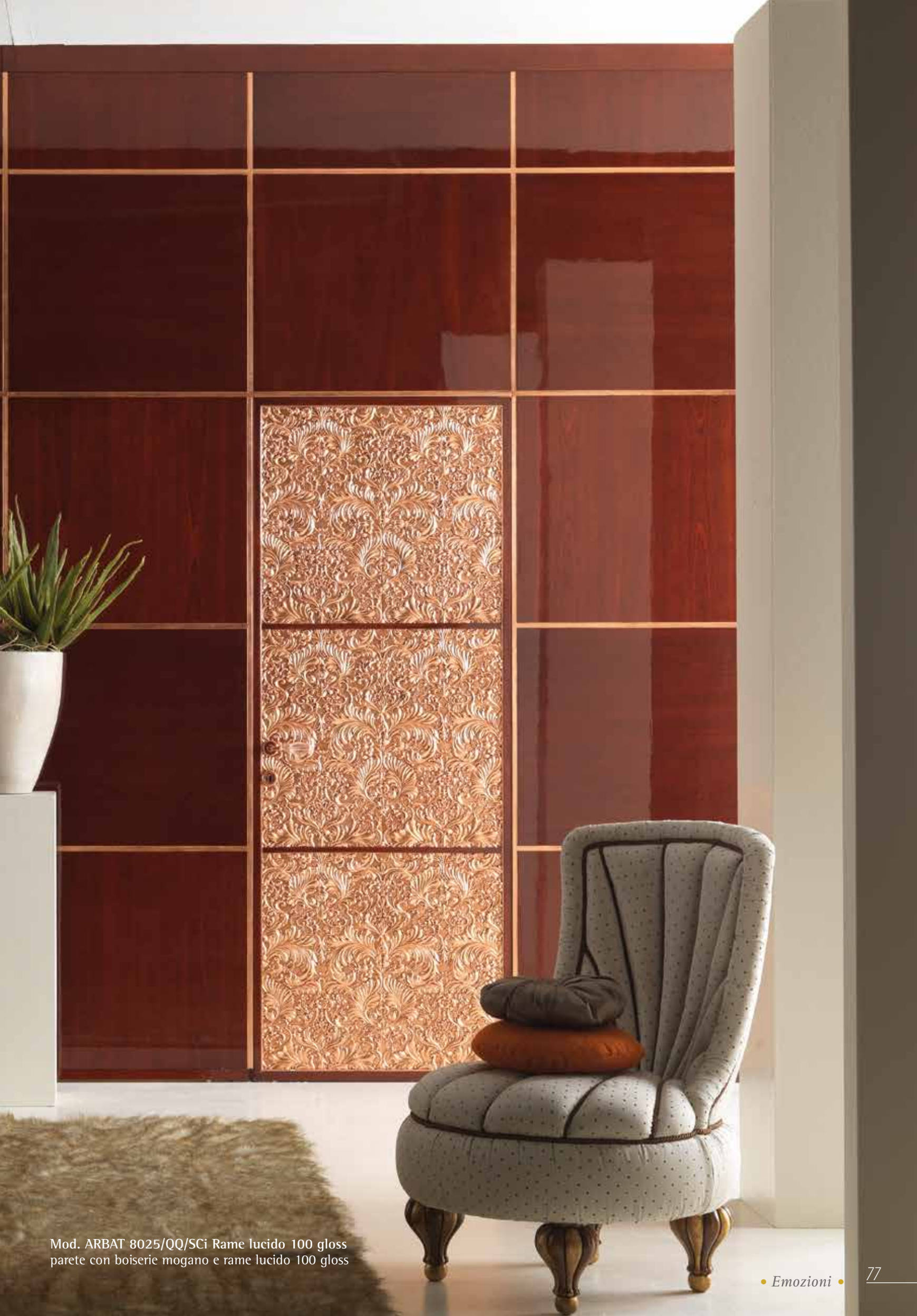
Mod. ARBAT 8025/QQ/SCi Rame lucido 100 gloss parete con boiserie mogano e rame lucido 100 gloss