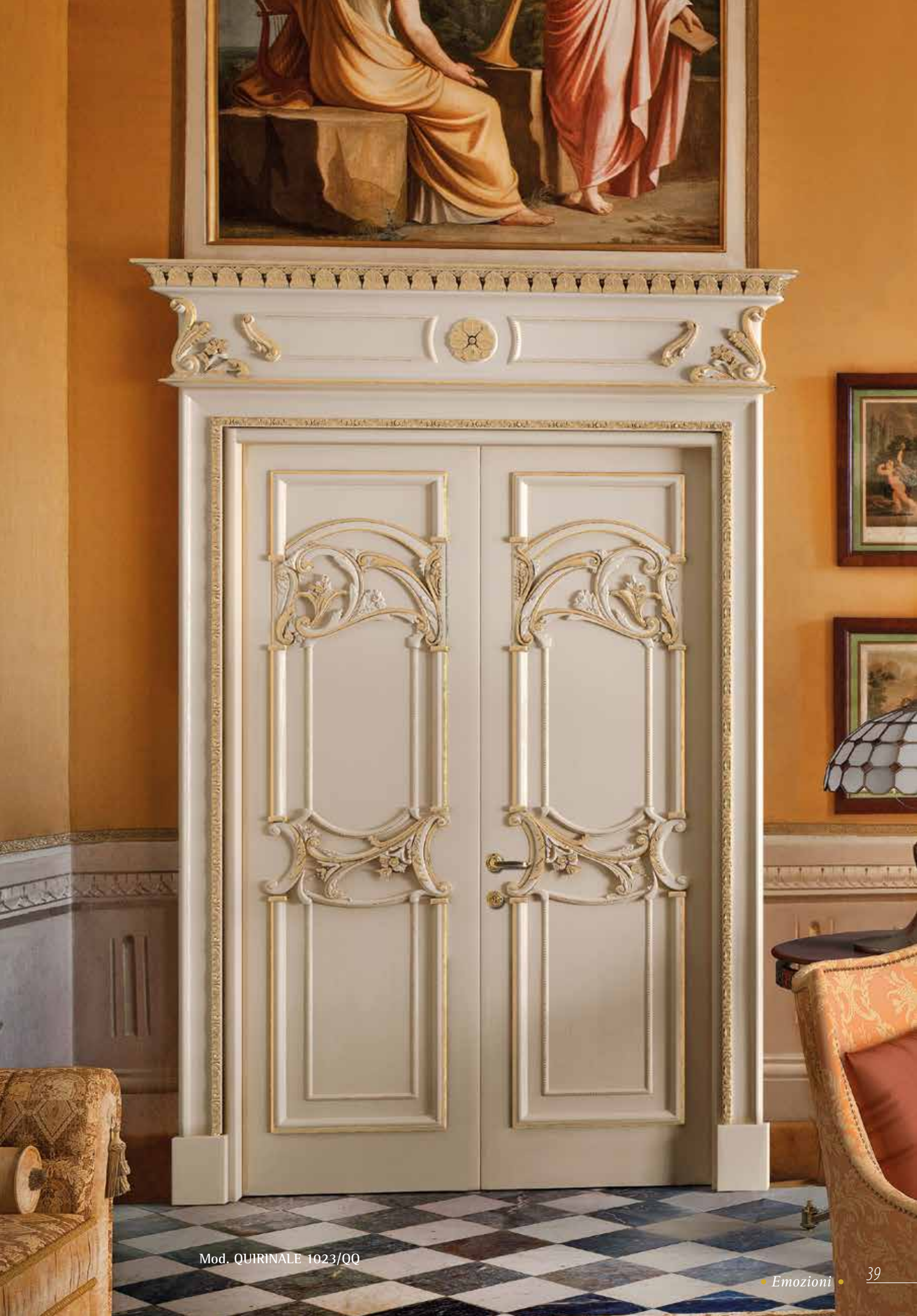
Mod. QUIRINALE 1023/Q0