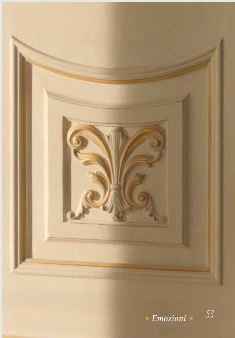
Mod. LUIGI XVI 2/A 4014/QQ/INT/INF/V coprifilo con cimasa LUIGI XVI tipo A patinato oro sbiancato. Imbotte con Boiserie Luigi XVI con intagli