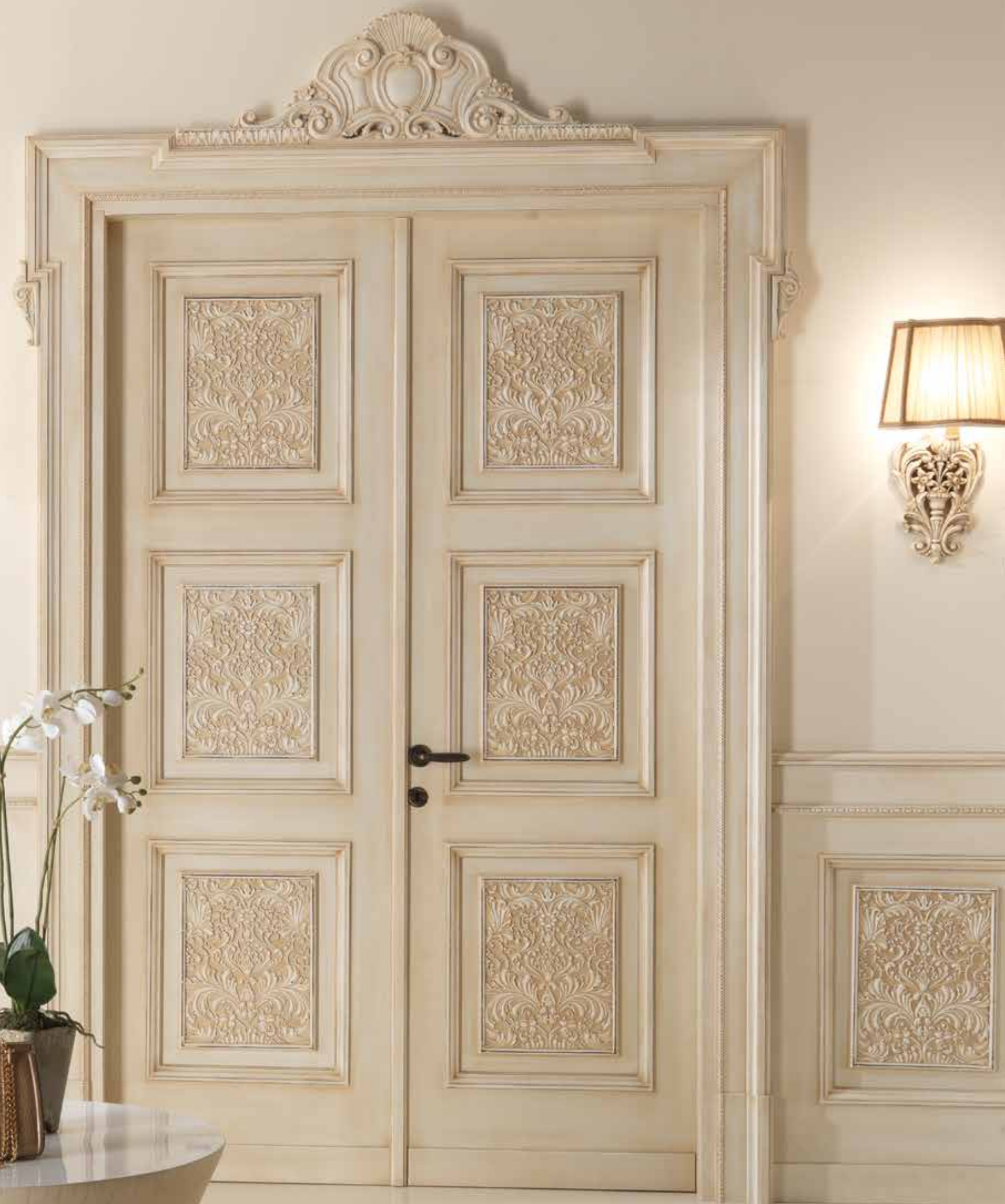
Mod. CARRACCI "ARBAT" 2016 IN1/QQ telaio R10, coprifilo con cimasa Carracci patinato invecchiato