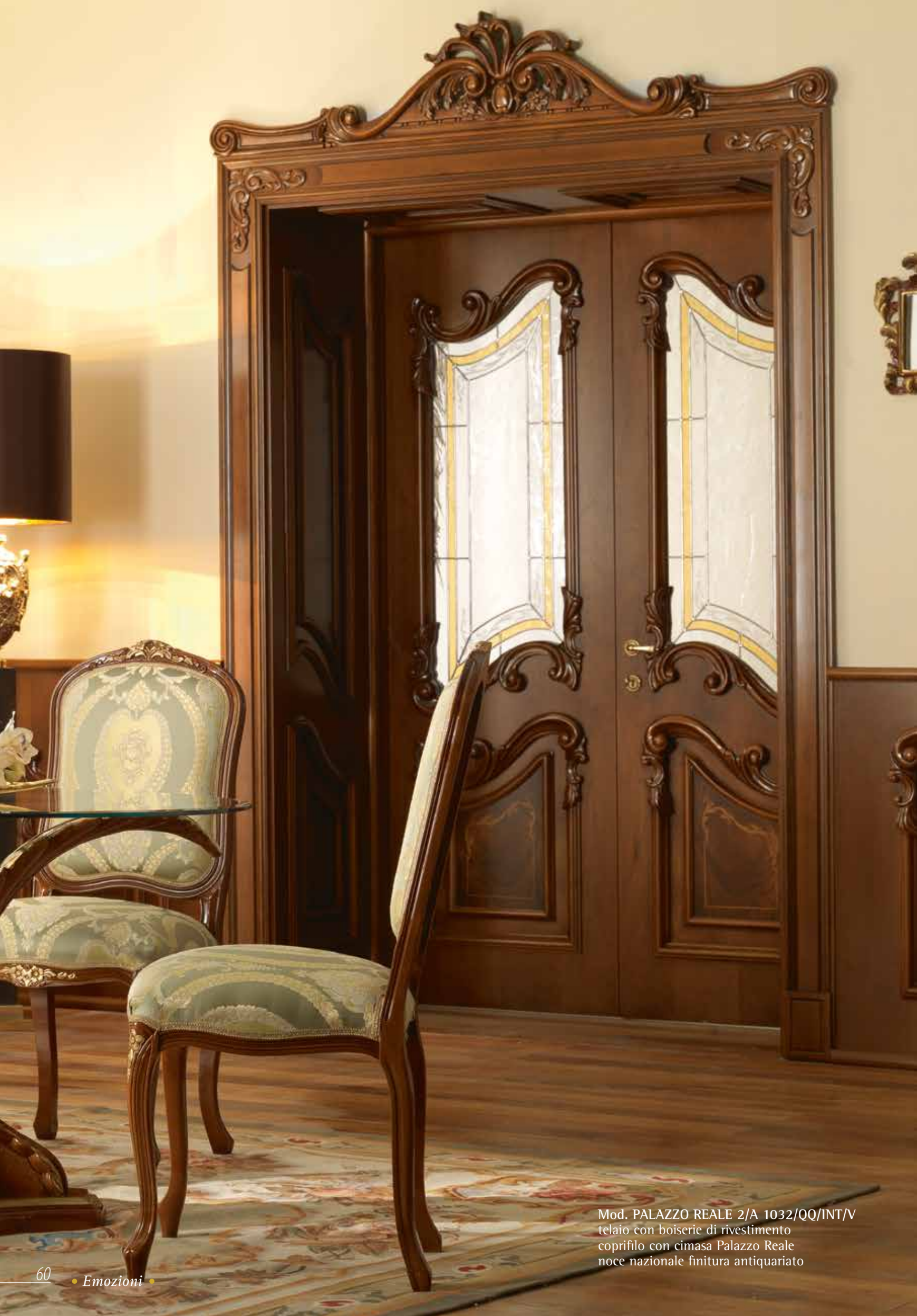
Mod. PALAZZO REALE 2/A 1032/QQ/INT/V telaio con boiserie di rivestimento coprifilo con cimasa Palazzo Reale noce nazionale finitura antiquariato