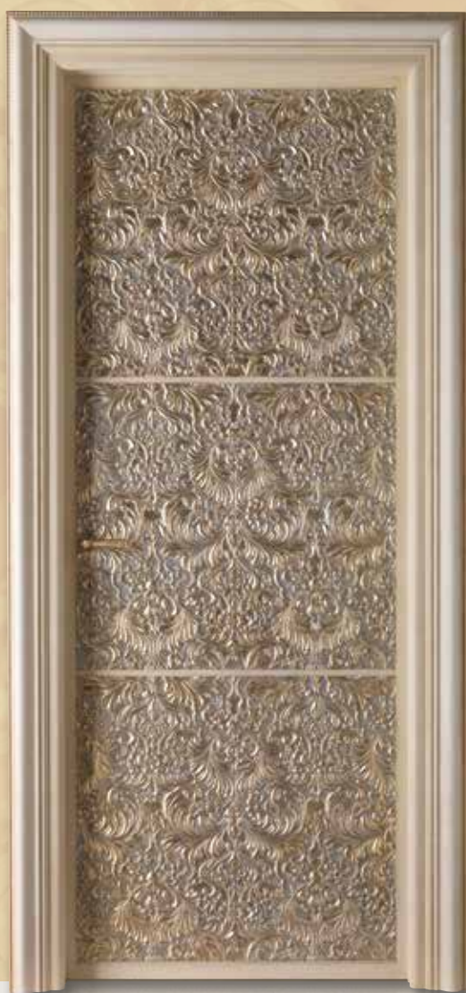
Mod. ARBAT 8025/QQ/SCi telaio LMA, coprifilo San Pietroburgo oro patina argento