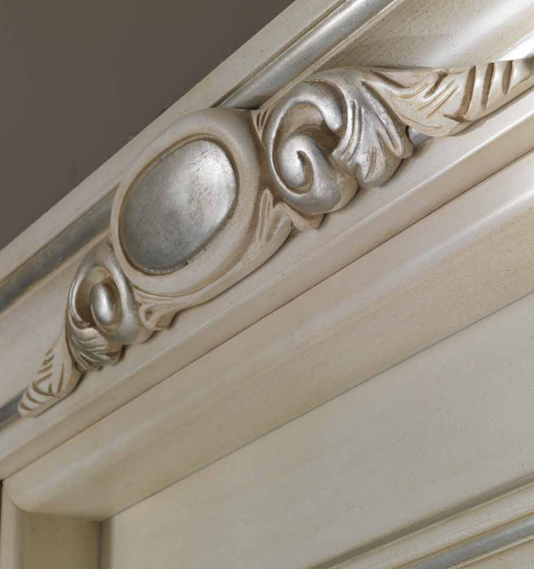
Particolare Mod. PALAZZO ESTENSE 5018/QQ patinato con argento riflesso di luce