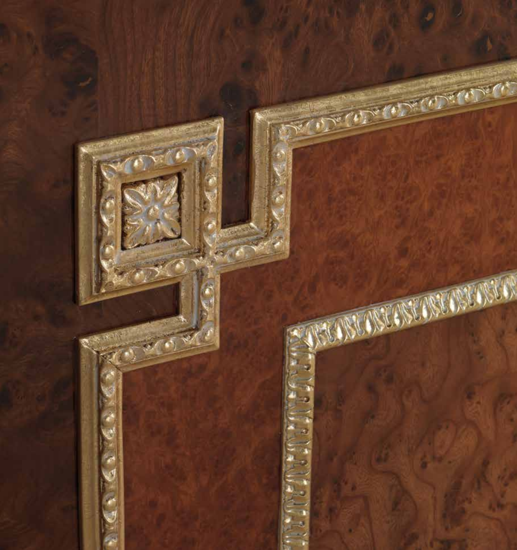
Particolare Mod. TRIANON/B 1012B/QQ/INT