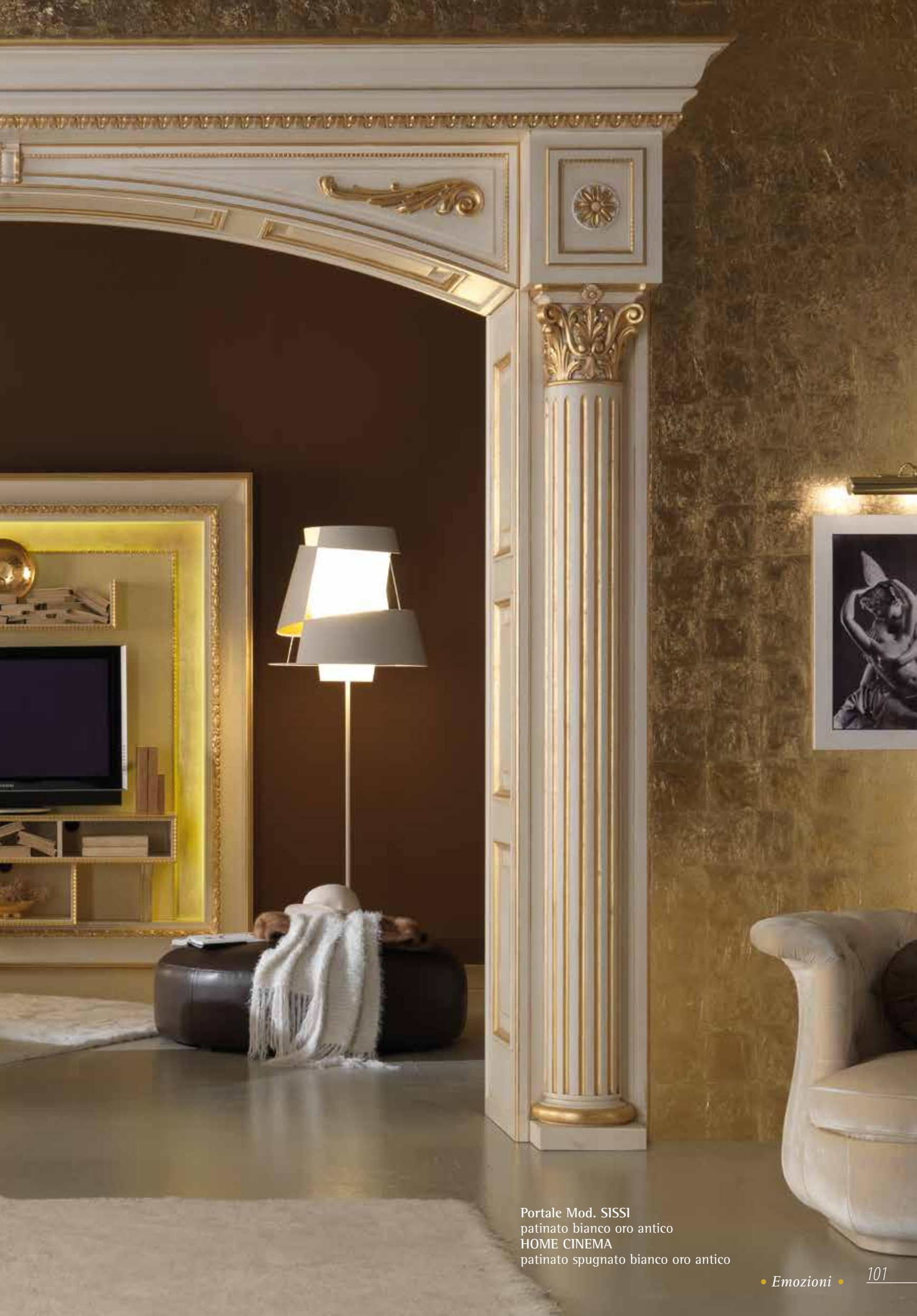
Portale Mod. SISSI patinato bianco oro antico HOME CINEMA patinato spugnato bianco oro antico