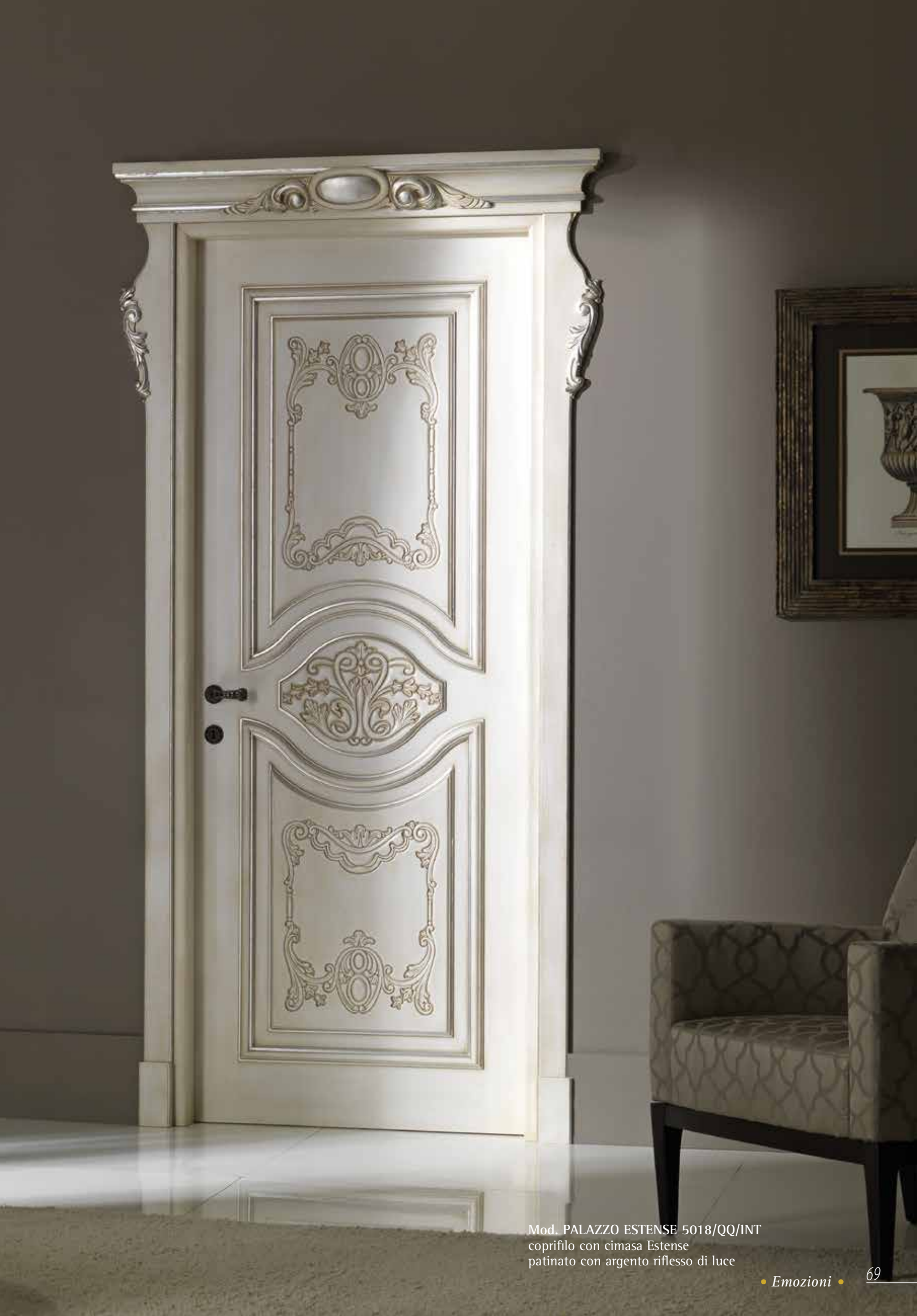
Mod. PALAZZO ESTENSE 5018/QQ/INT coprifilo con cimasa Estense patinato con argento riflesso di luce