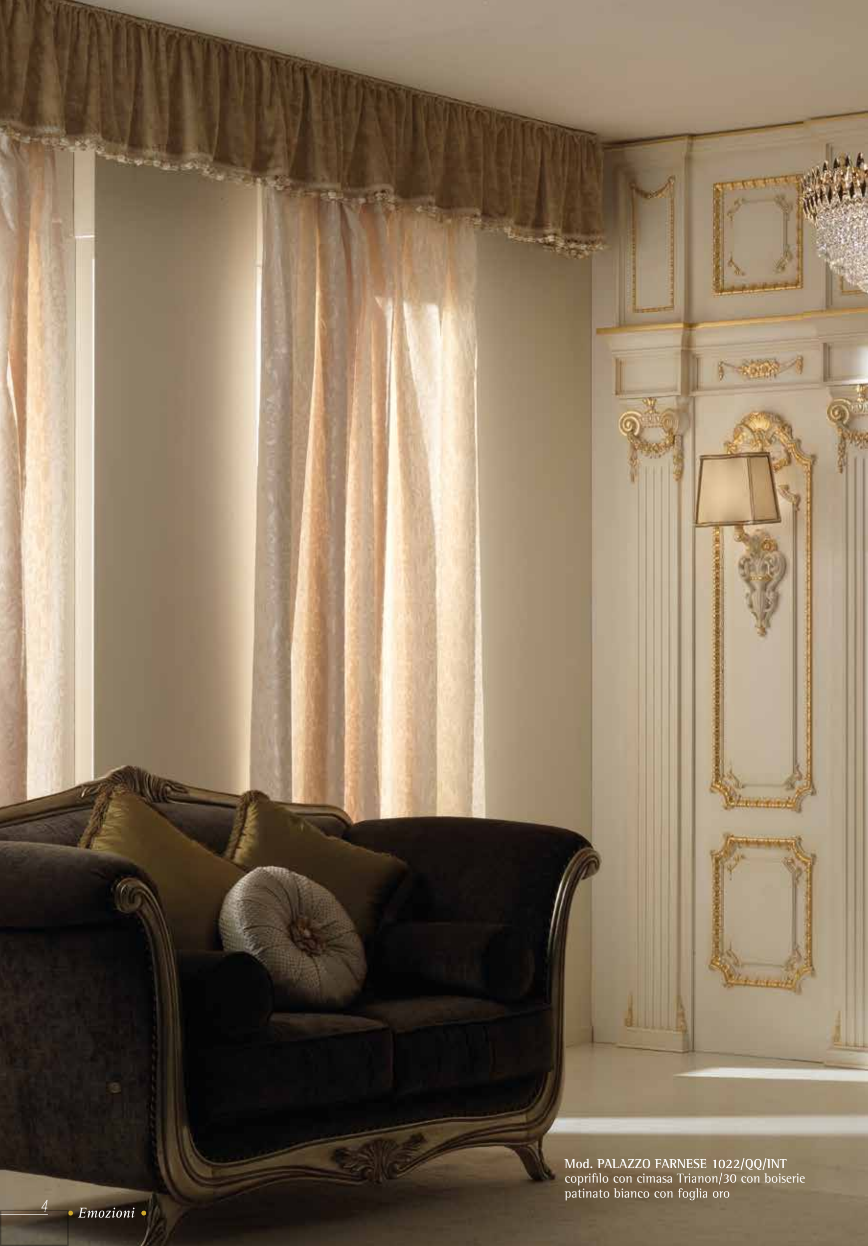
Mod. PALAZZO FARNESE 1022/QQ/INT coprifilo con cimasa Trianon/30 con boiserie patinato bianco con foglia oro