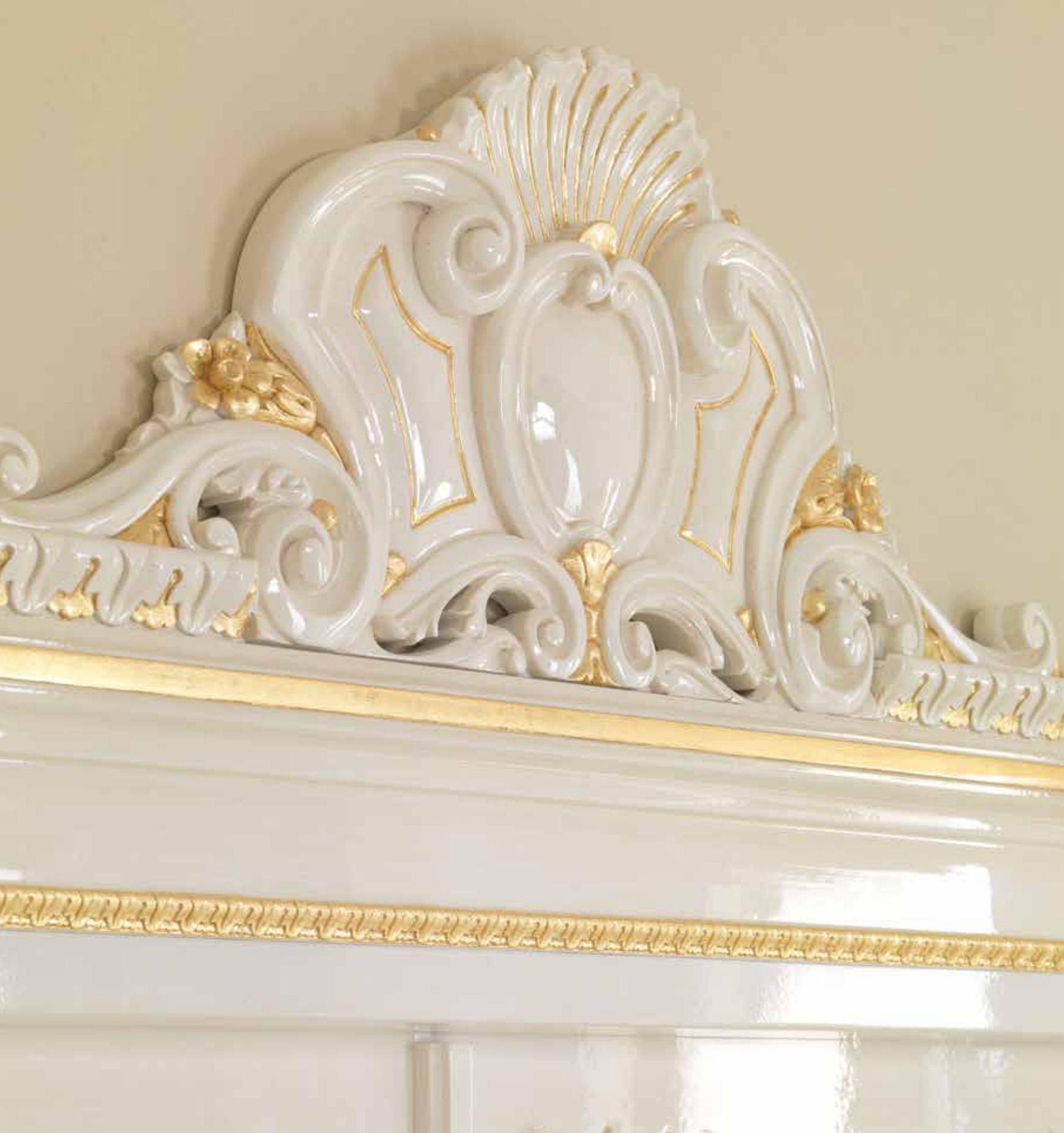
Particolare Mod. CASTELLO DI CHANTILLY 2018/QQ pennellato con oro a trama finitura lucida