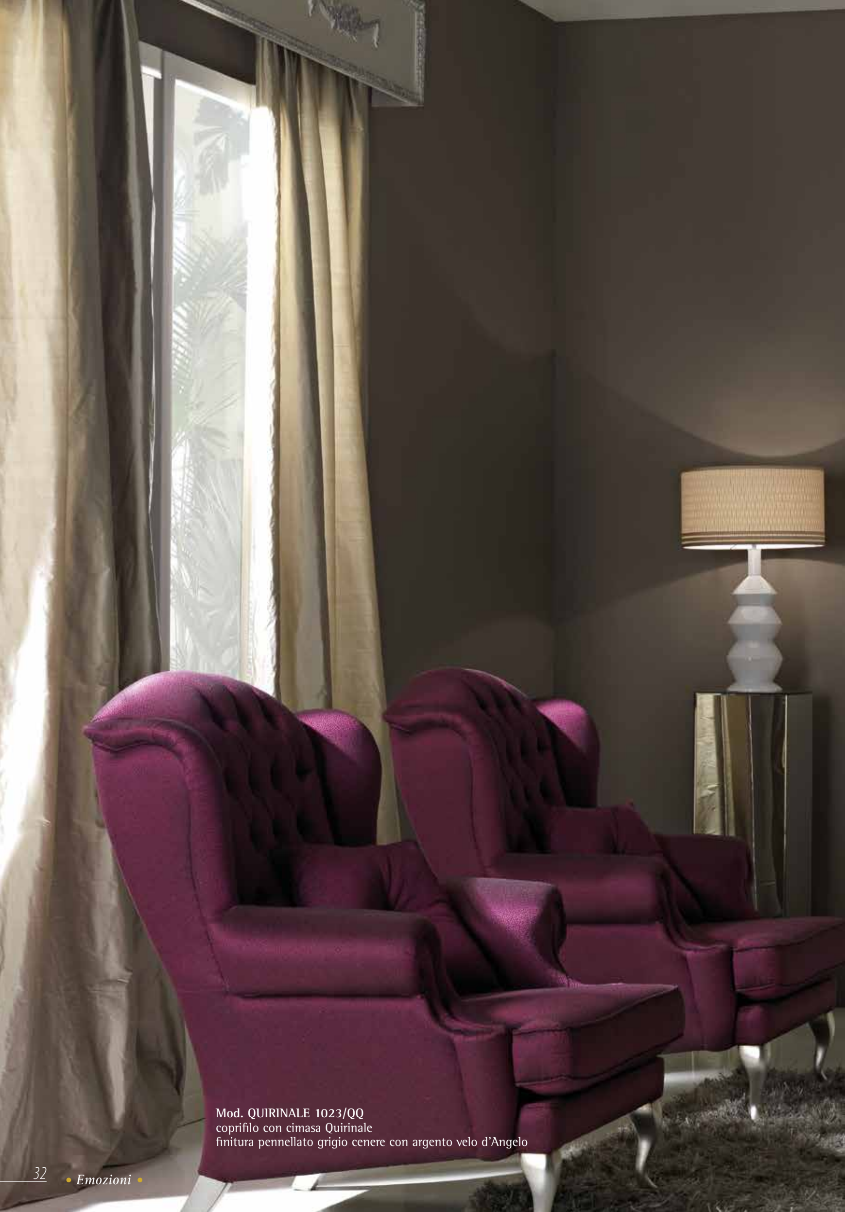
Mod. QUIRINALE 1023/QQ coprifilo con cimasa Quirinale finitura pennellato grigio cenere con argento velo d'Angelo