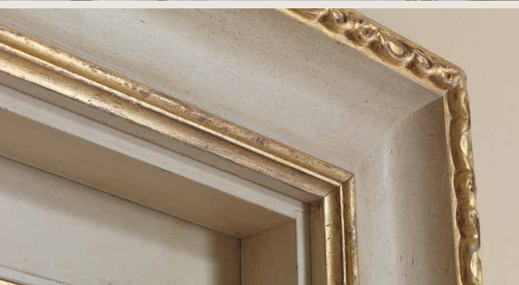
Mod. CARRACCI 2016/QQ coprifilo Toscano patinato oro toscano