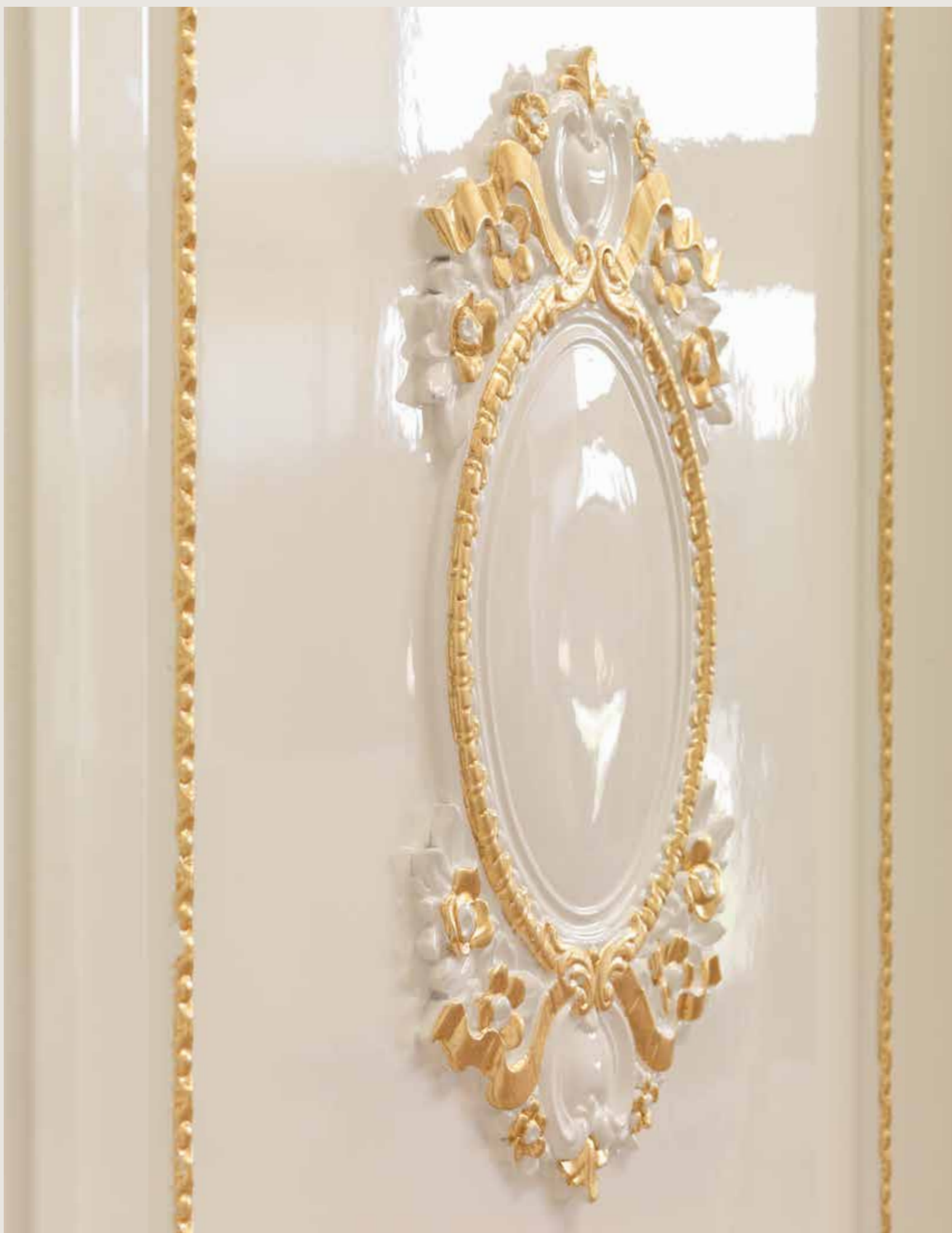
particolare Mod. TRIANON finitura bianco lucido100 gloss e foglia oro