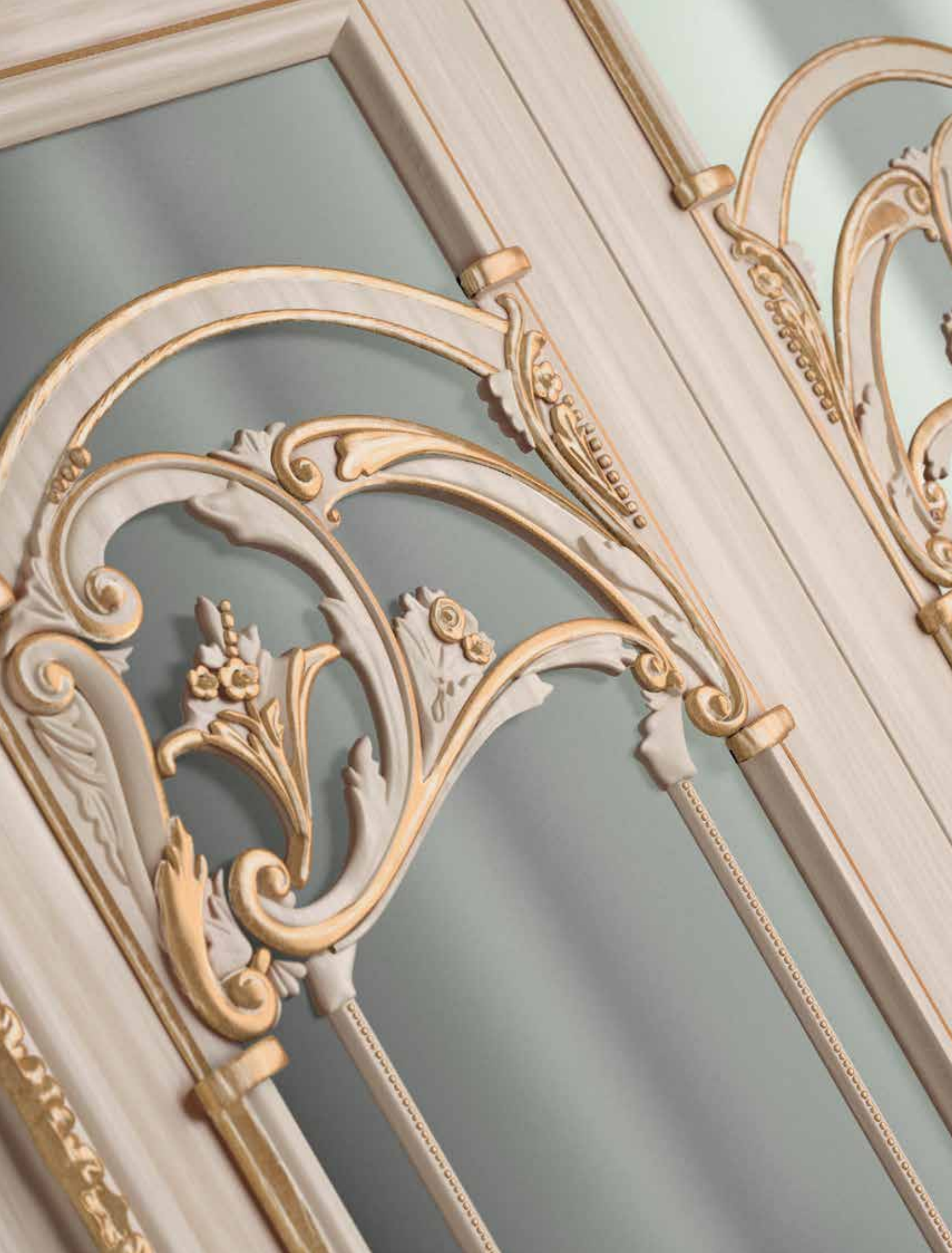
Mod. QUIRINALE 1023/QQ/V particolare versione anta a vetro