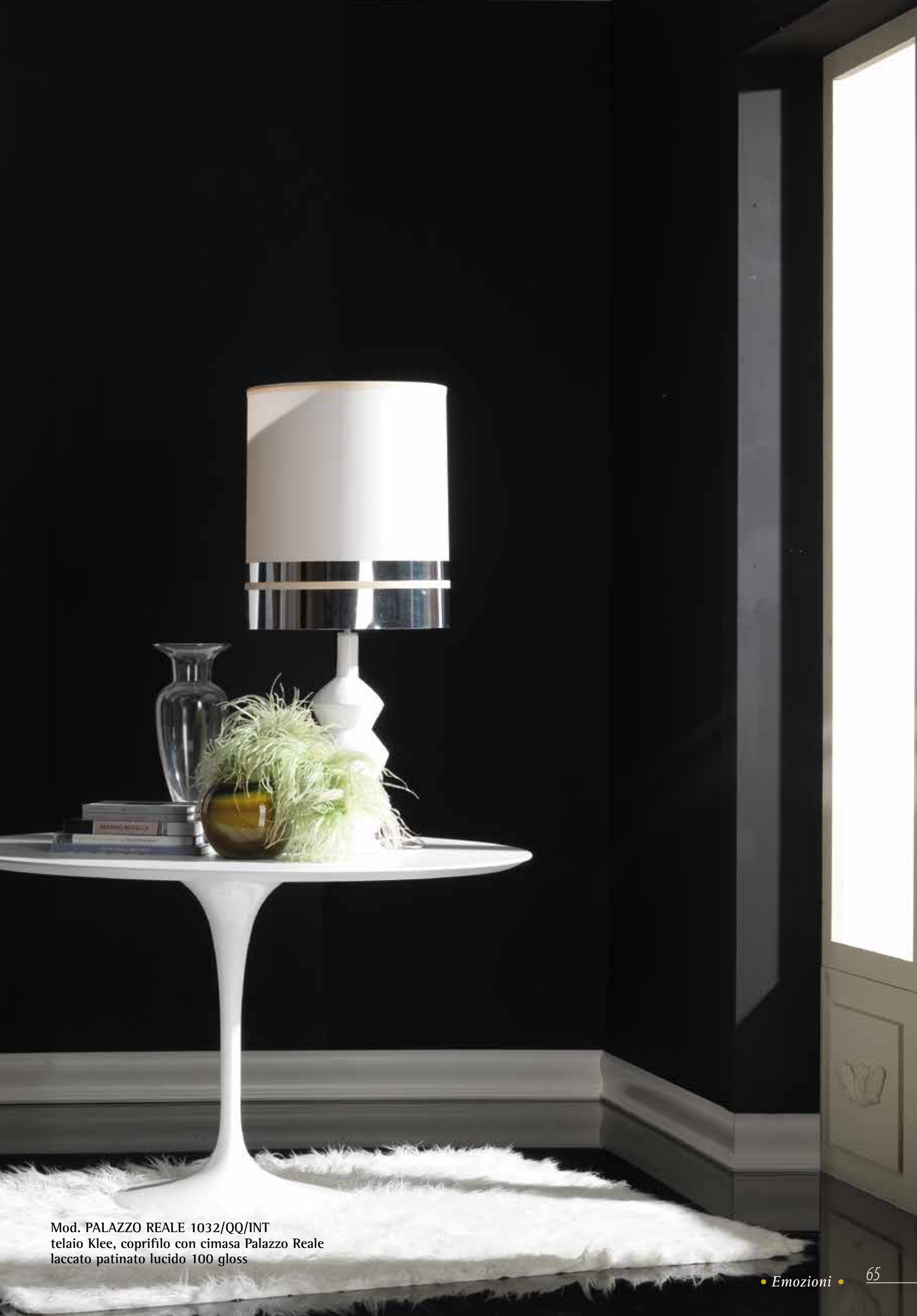
Mod. PALAZZO REALE 1032/QQ/INT telaio Klee, coprifilo con cimasa Palazzo Reale laccato patinato lucido 100 gloss