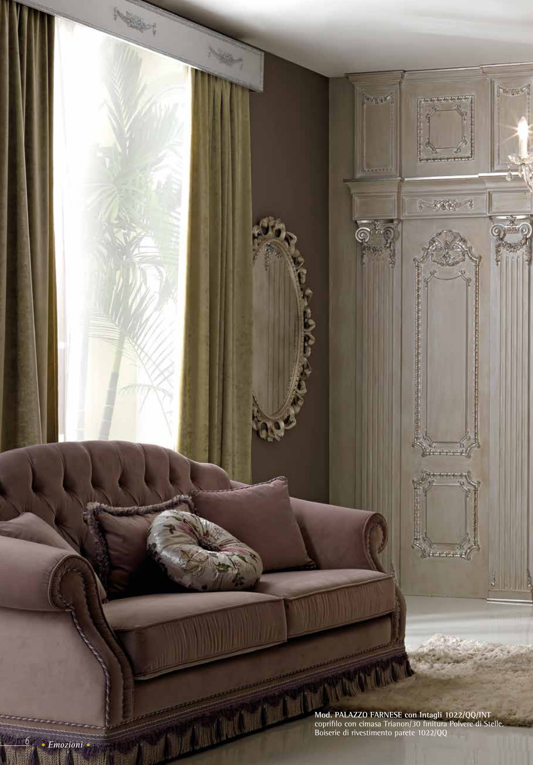
Mod. PALAZZO FARNESE con Intagli 1022/QQ/INT coprifilo con cimasa Trianon/30 finitura Polvere di Stelle. Boiserie di rivestimento parete 1022/QQ