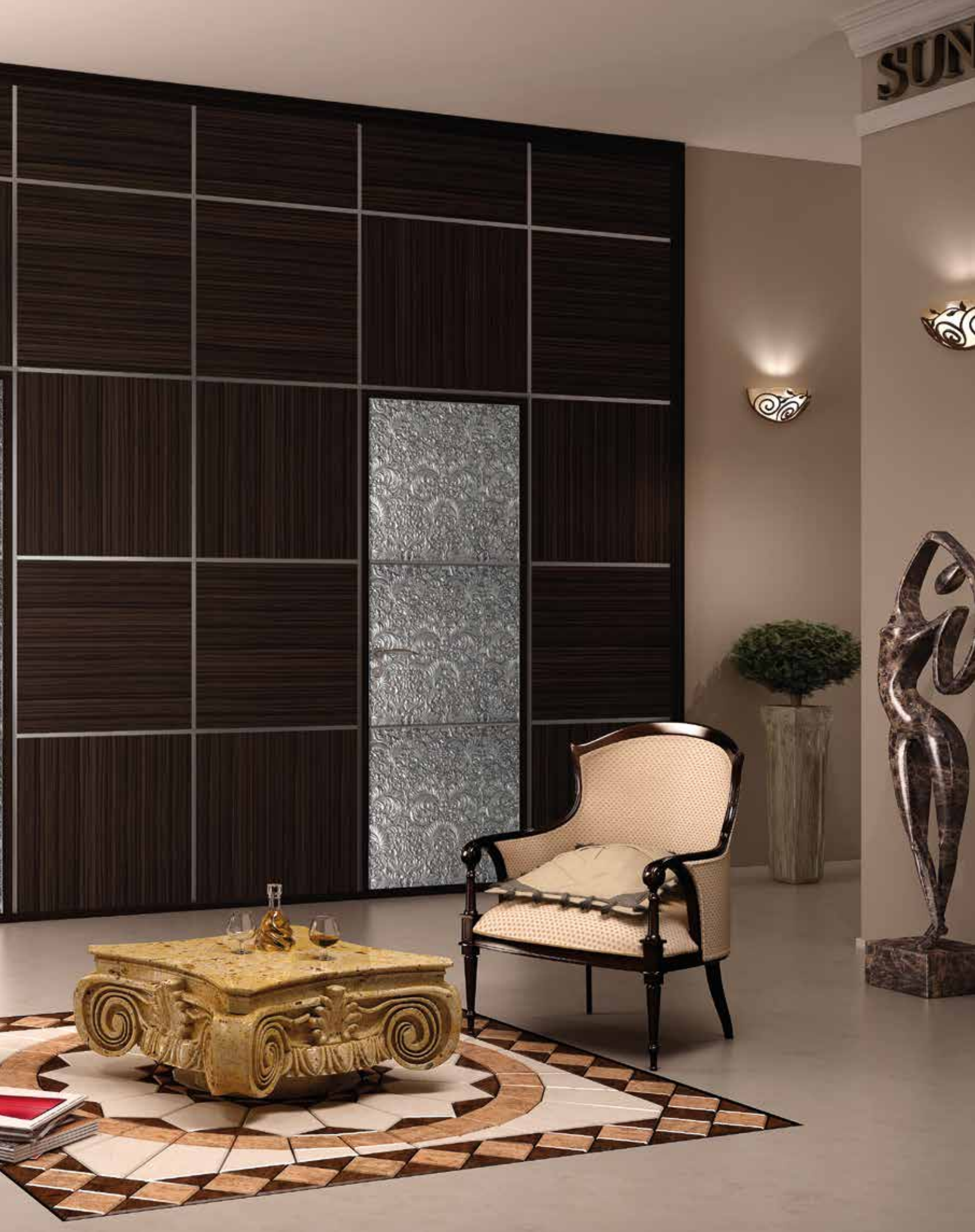
Mod. ARBAT 8025/QQ/SCi Argento parete con boiserie ebano precomposto lucido spazzolato