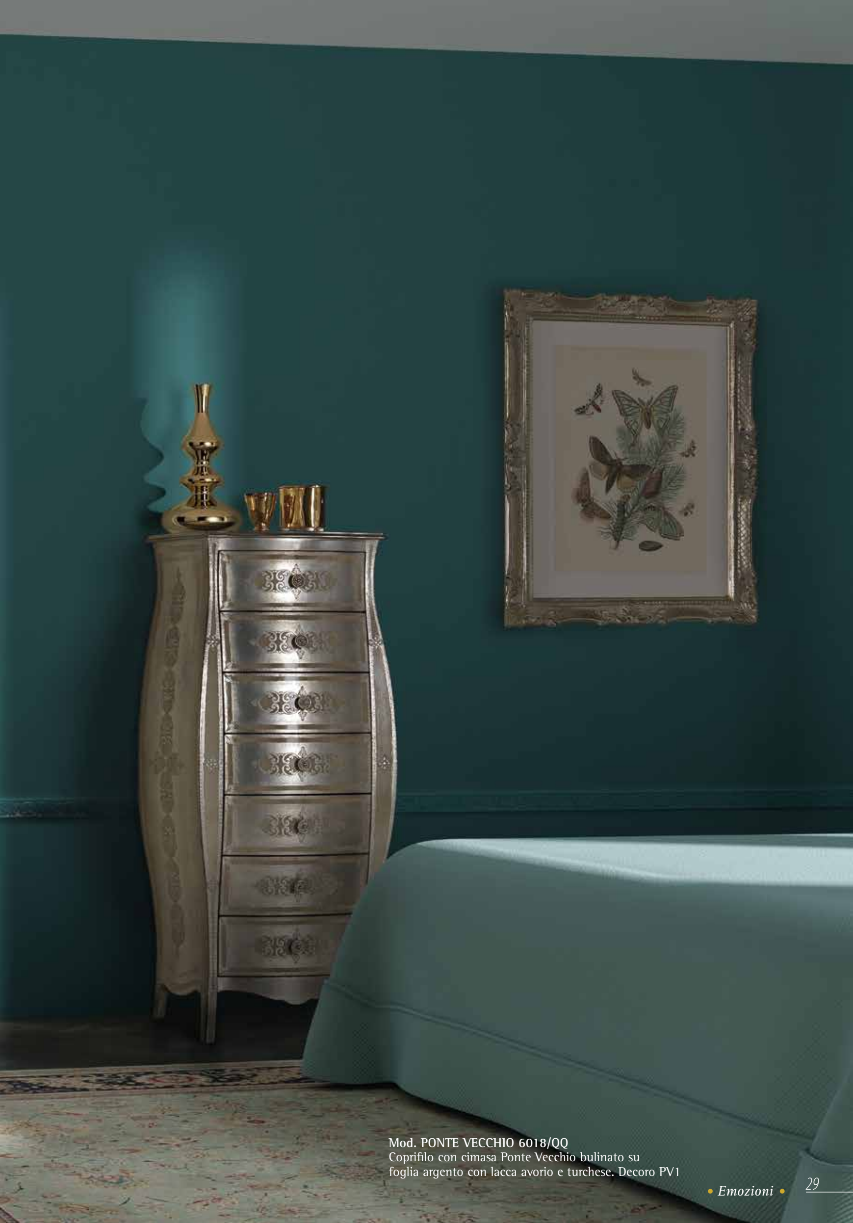
Mod. PONTE VECCHIO 6018/QQ Coprifilo con cimasa Ponte Vecchio bulinato su foglia argento con lacca avorio e turchese. Decoro PV1