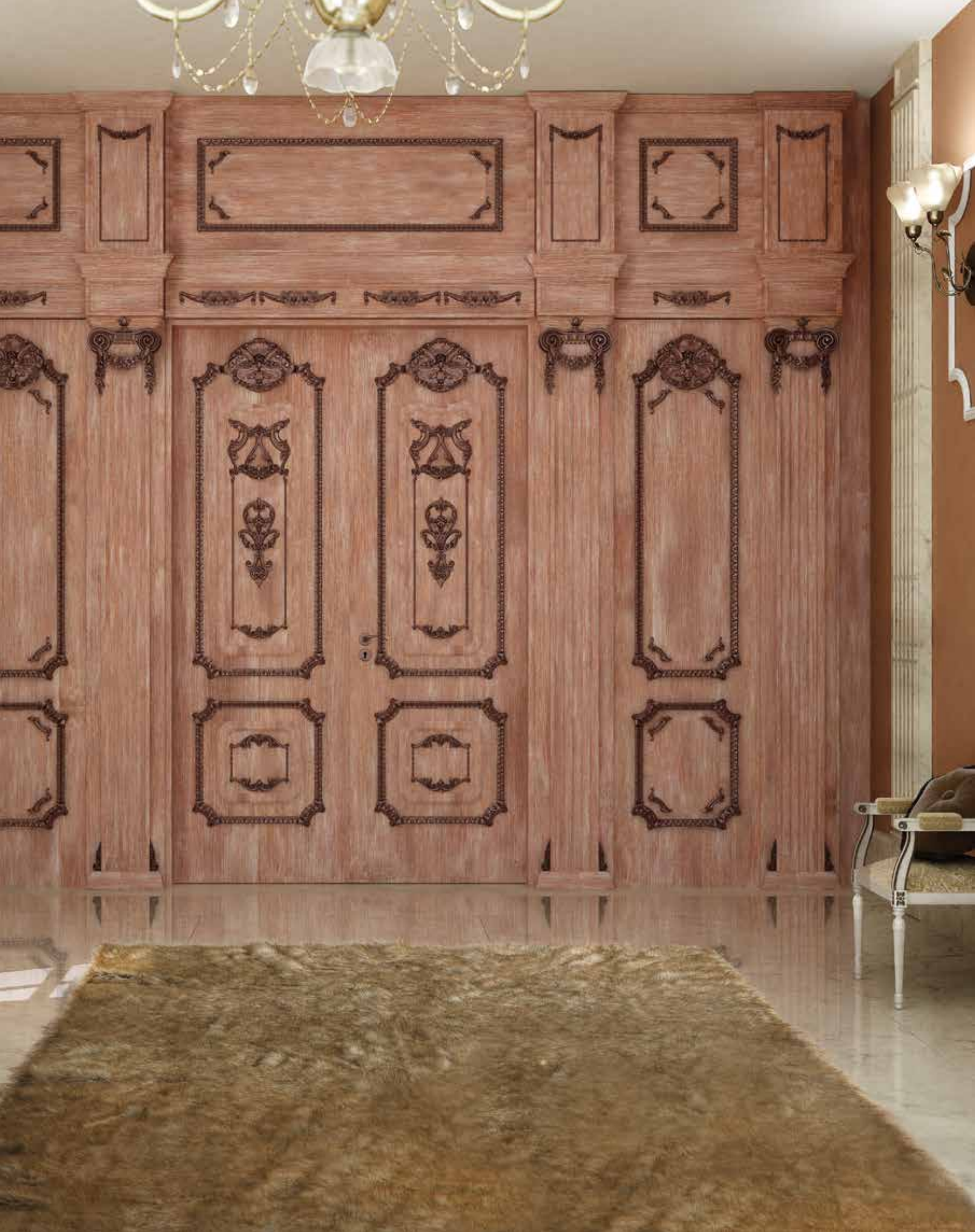
Mod. PALAZZO FARNESE 1022/QQ/INT rovere french coprifilo con cimasa Trianon/30, boiserie di rivestimento parete 1022/QQ