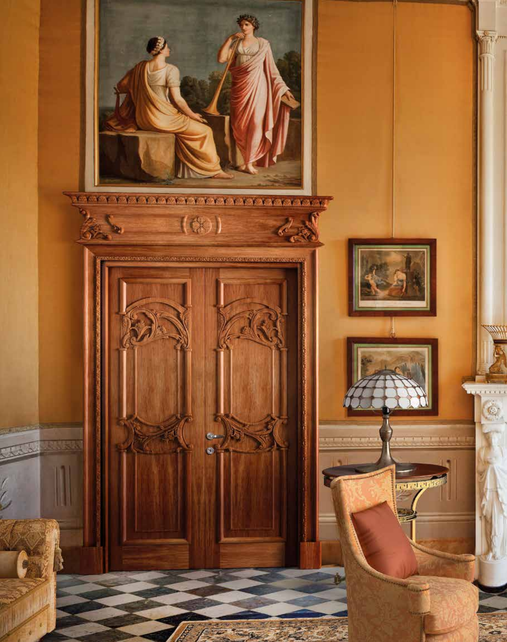
Mod. QUIRINALE 1023/QQ coprifilo con cimasa Quirinale finitura rovere patinato