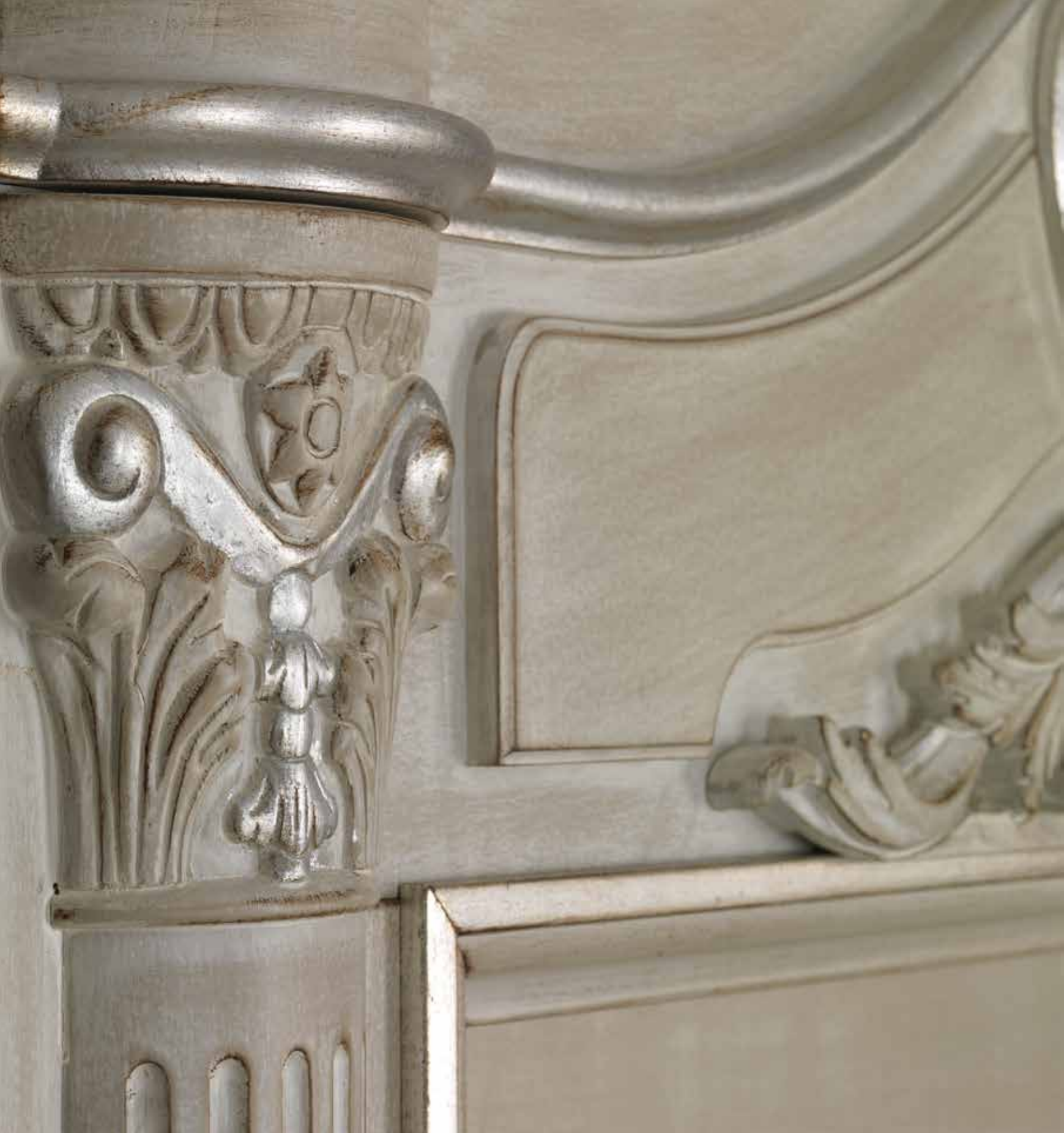
Particolare Mod. LUIGI XVI con intaglio 4014/QQ/INT