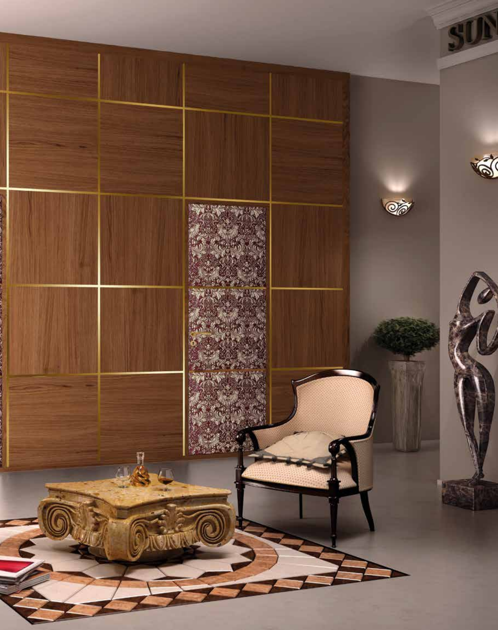
Mod. ARBAT 8025/QQ/SCi Rosso e foglia Oro parete con boiserie noce nazionale medio