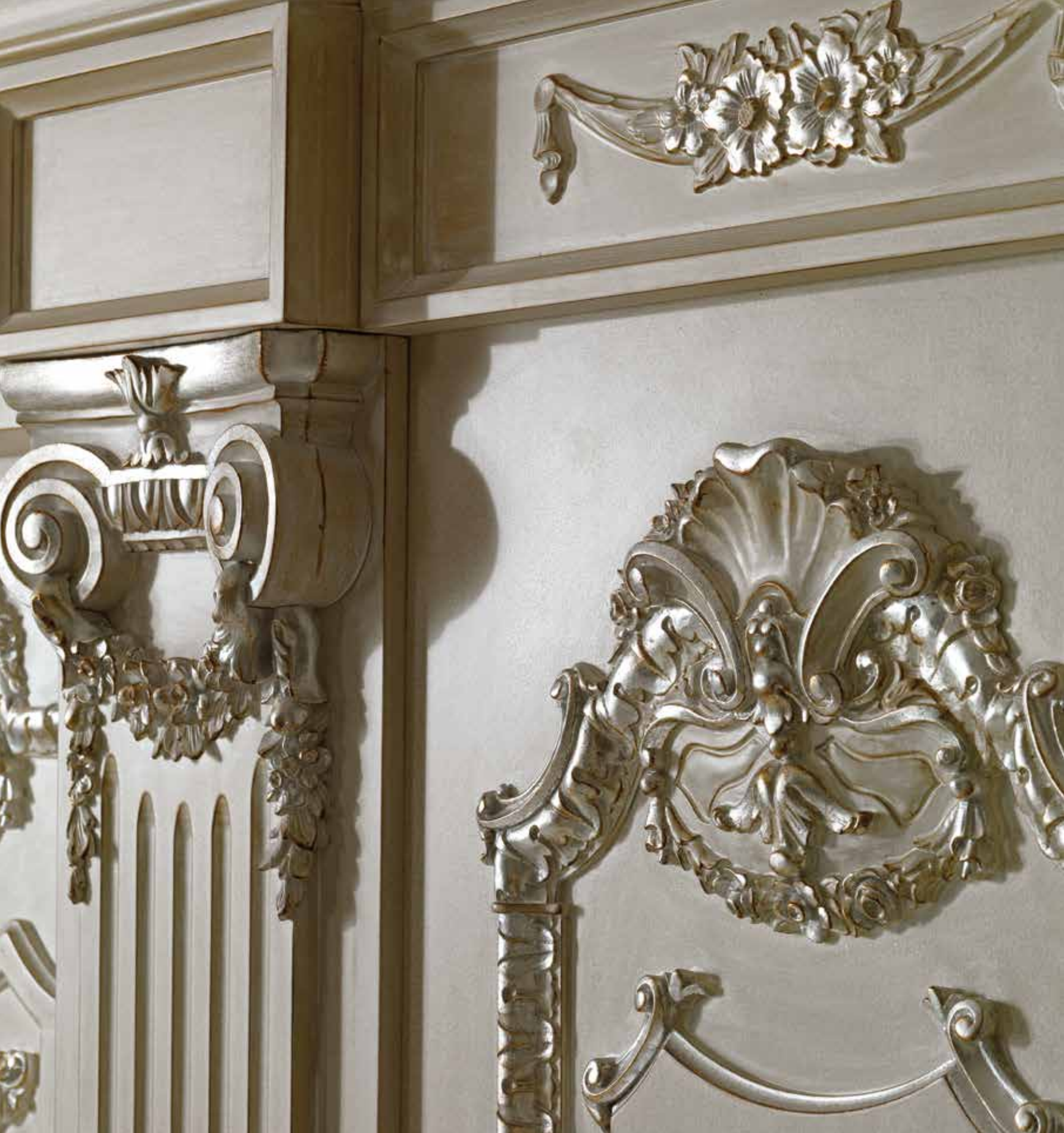
Particolare Mod. PALAZZO FARNESE con Intagli 1022/QQ/INT finitura Polvere di Stelle