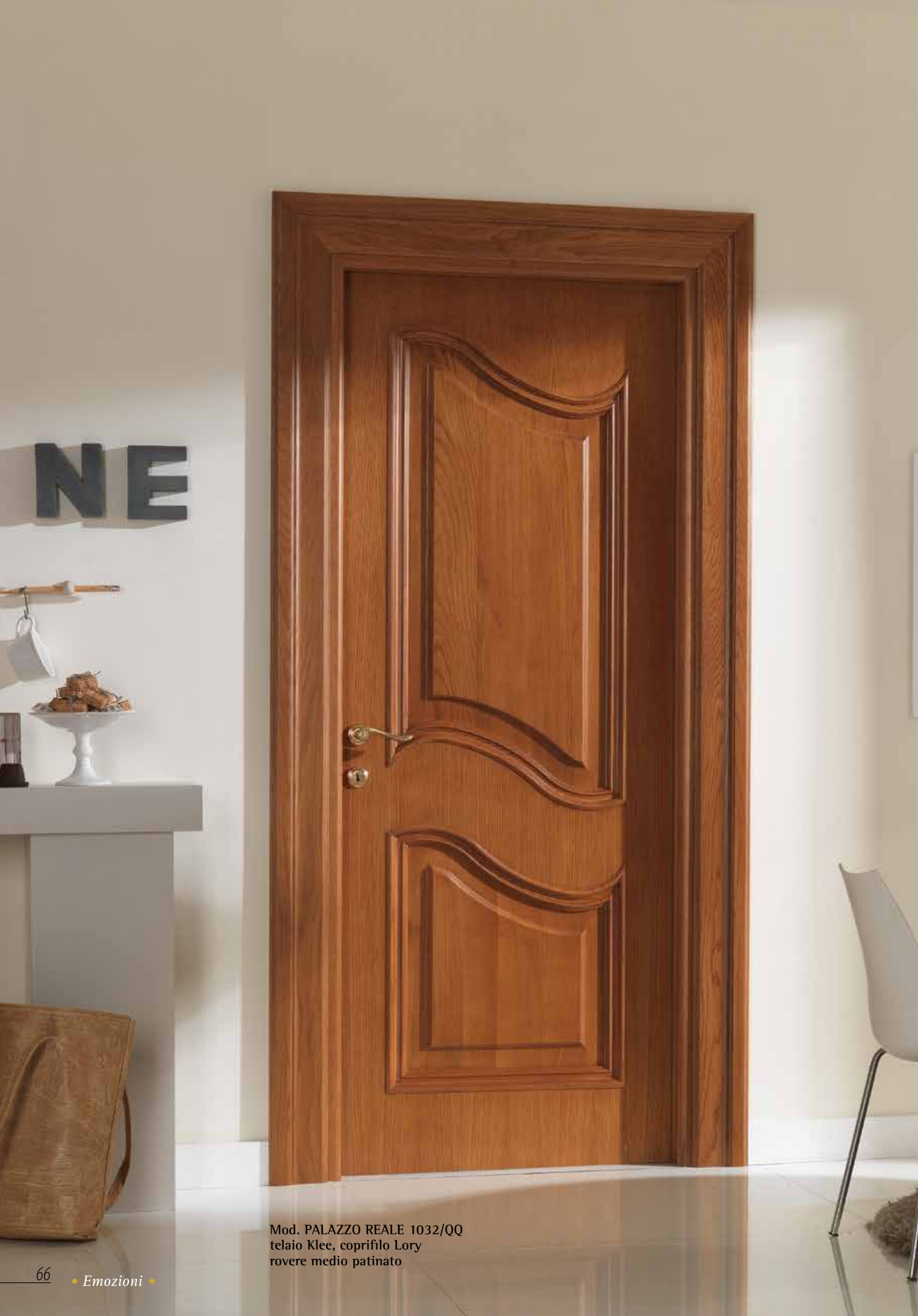
Mod. PALAZZO REALE 1032/QQ telaio Klee, coprifilo Lory rovere medio patinato