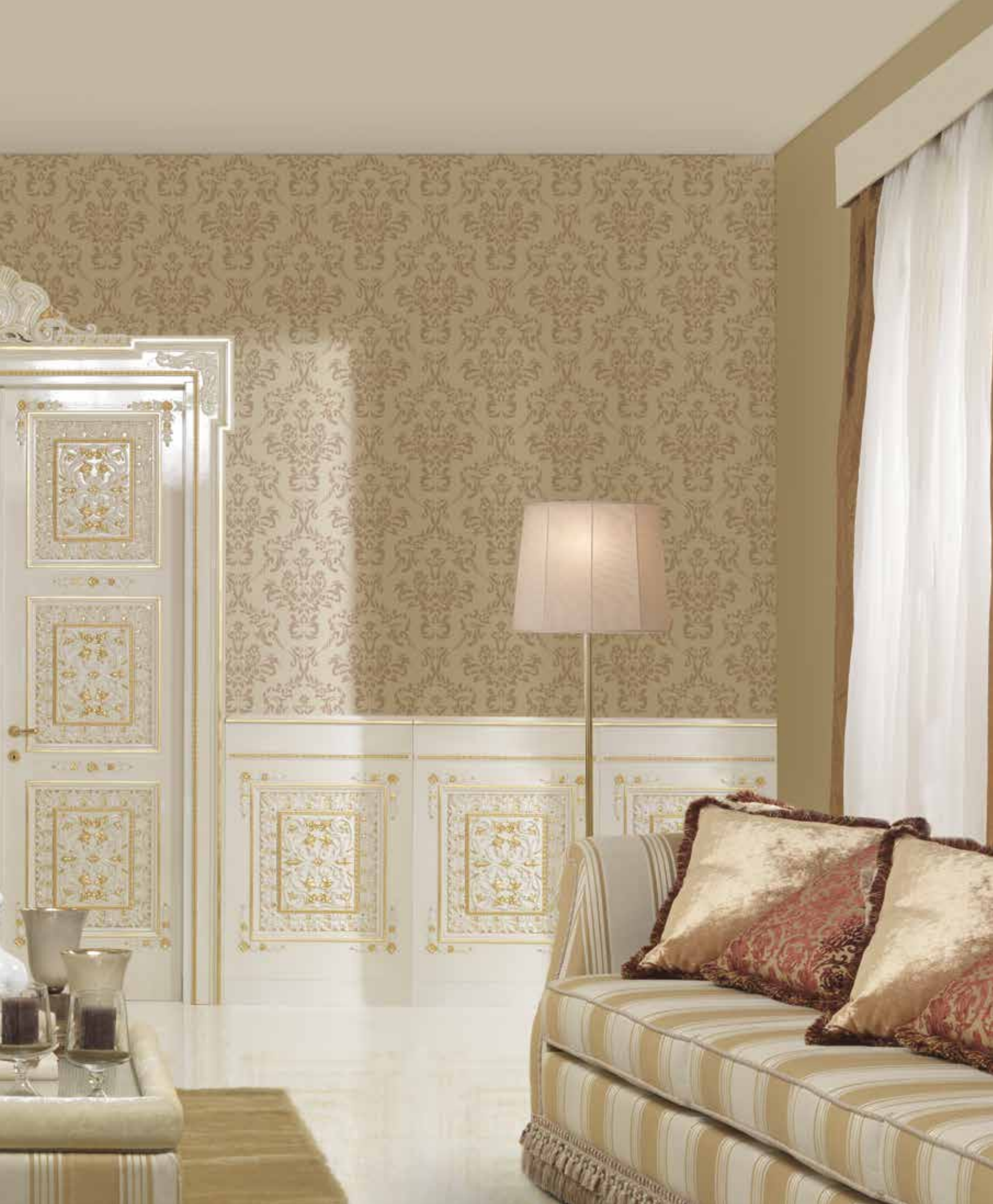
Mod. CASTELLO DI CHANTILLY 2018/QQ coprifilo con cimasa Carracci pennellato con oro a trama finitura lucida