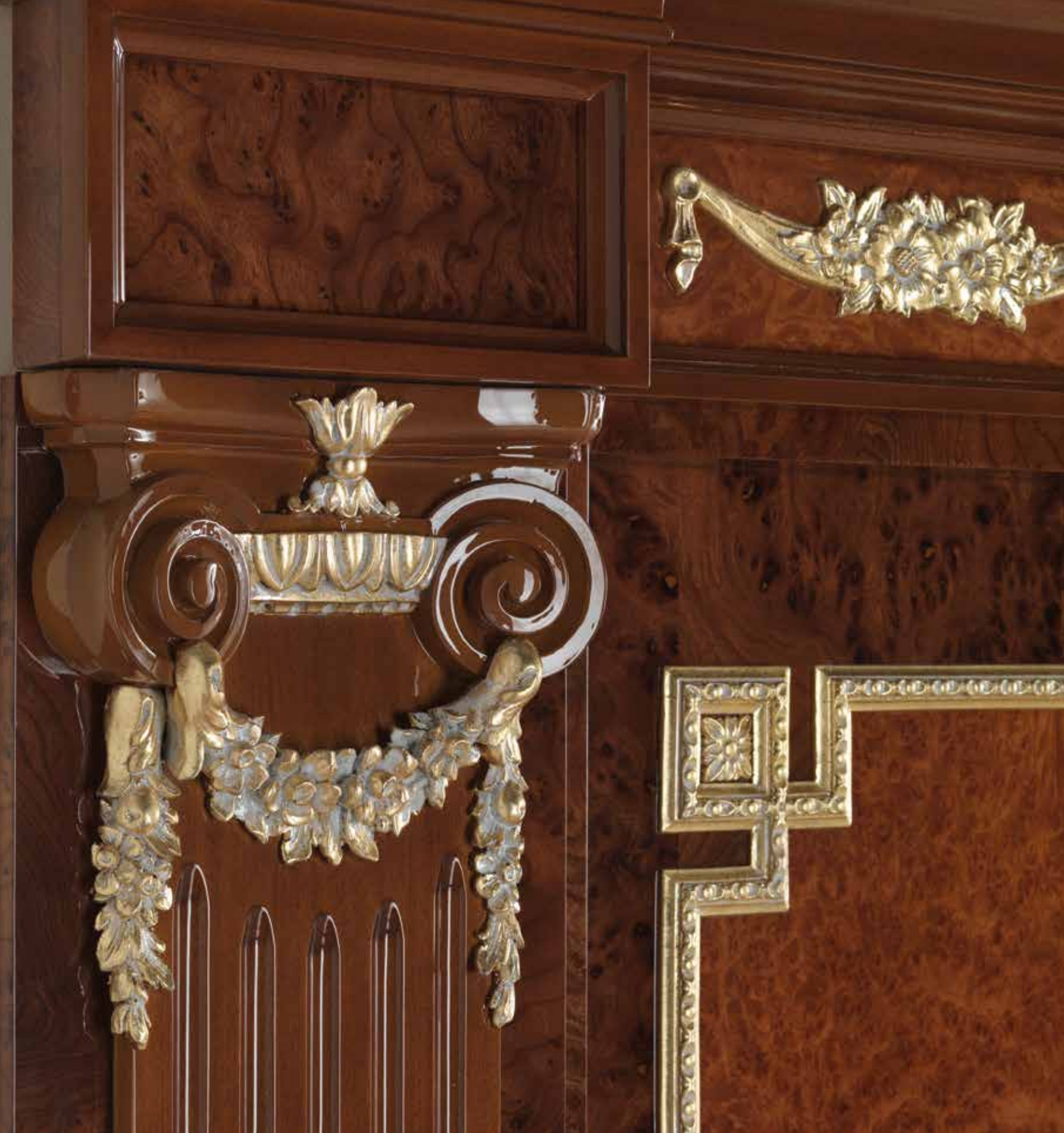
Particolare Mod. TRIANON/B 1012B/QQ/INT