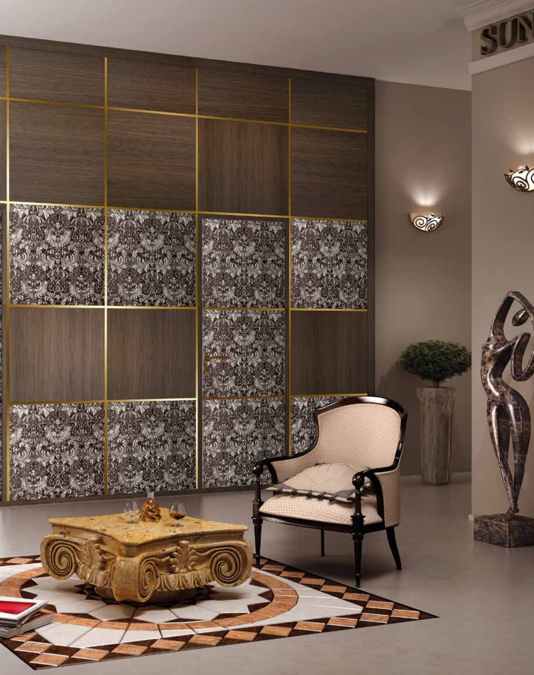
Mod. ARBAT 8025/QQ/SCi Marrone e foglia Argento parete con boiserie rovere finitura grigio sabbia spazzolato