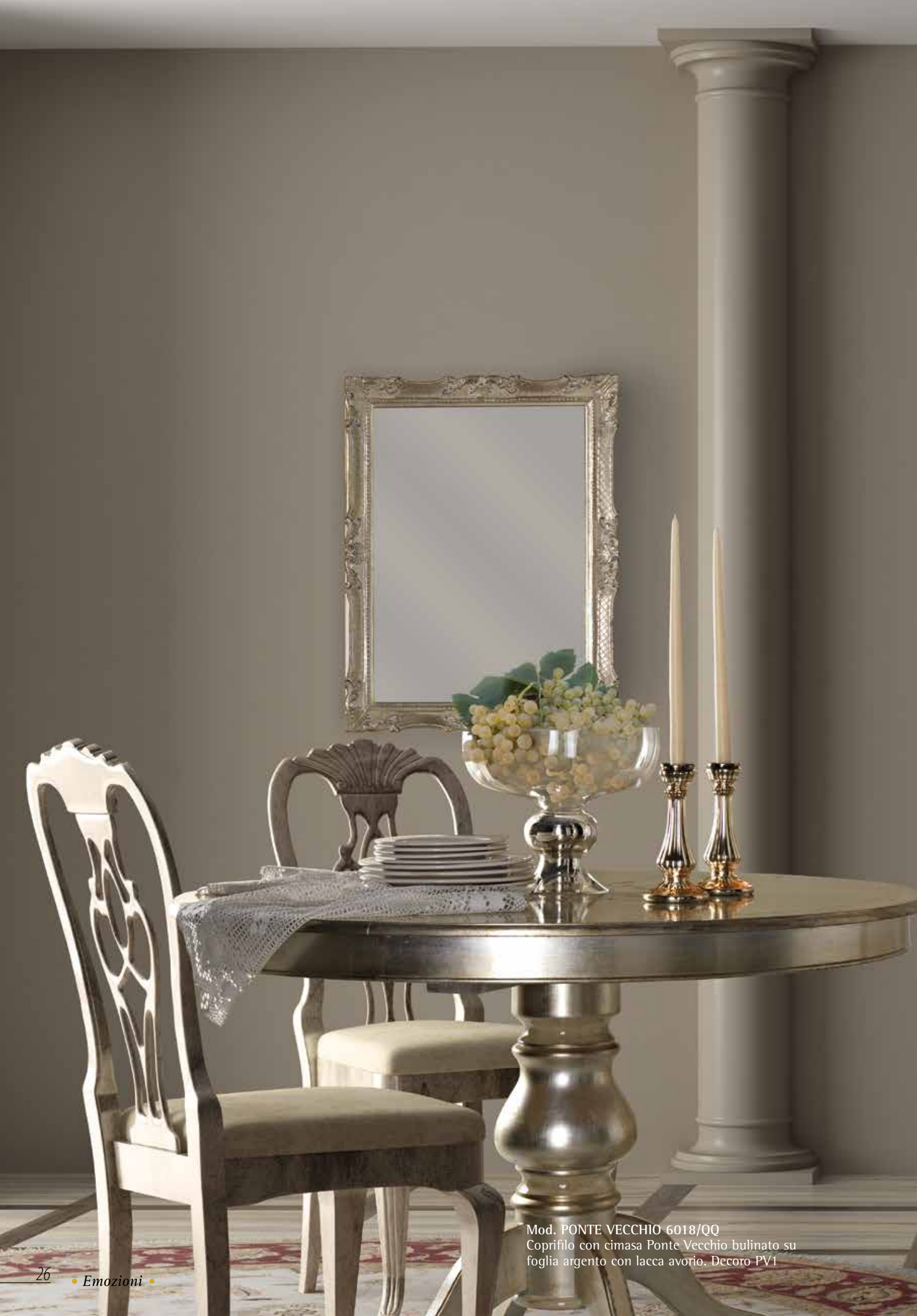
Mod. PONTE VECCHIO 6018/QQ Coprifilo con cimasa Ponte Vecchio bulinato su foglia argento con lacca avorio. Decoro PV1