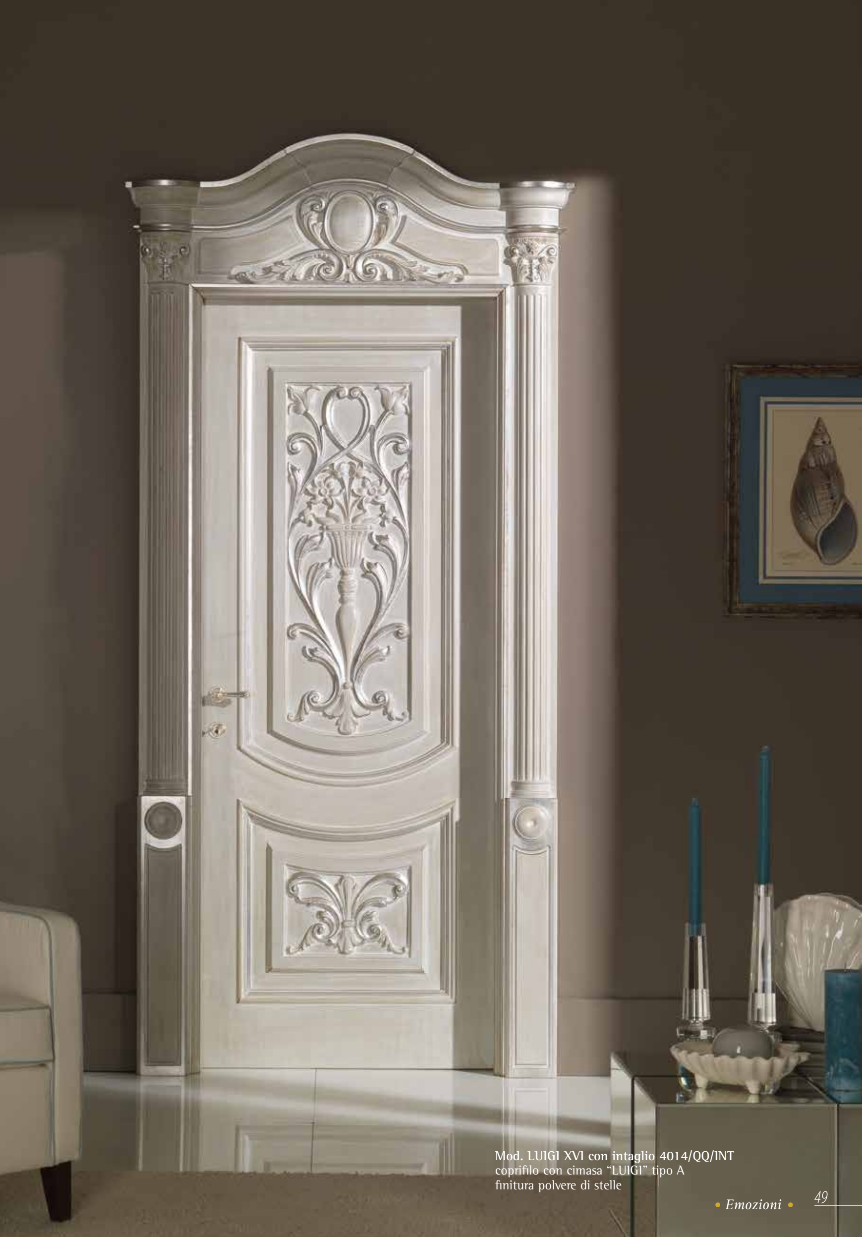
Mod. LUIGI XVI con intaglio 4014/QQ/INT coprifilo con cimasa "LUIGI" tipo A finitura polvere di stelle