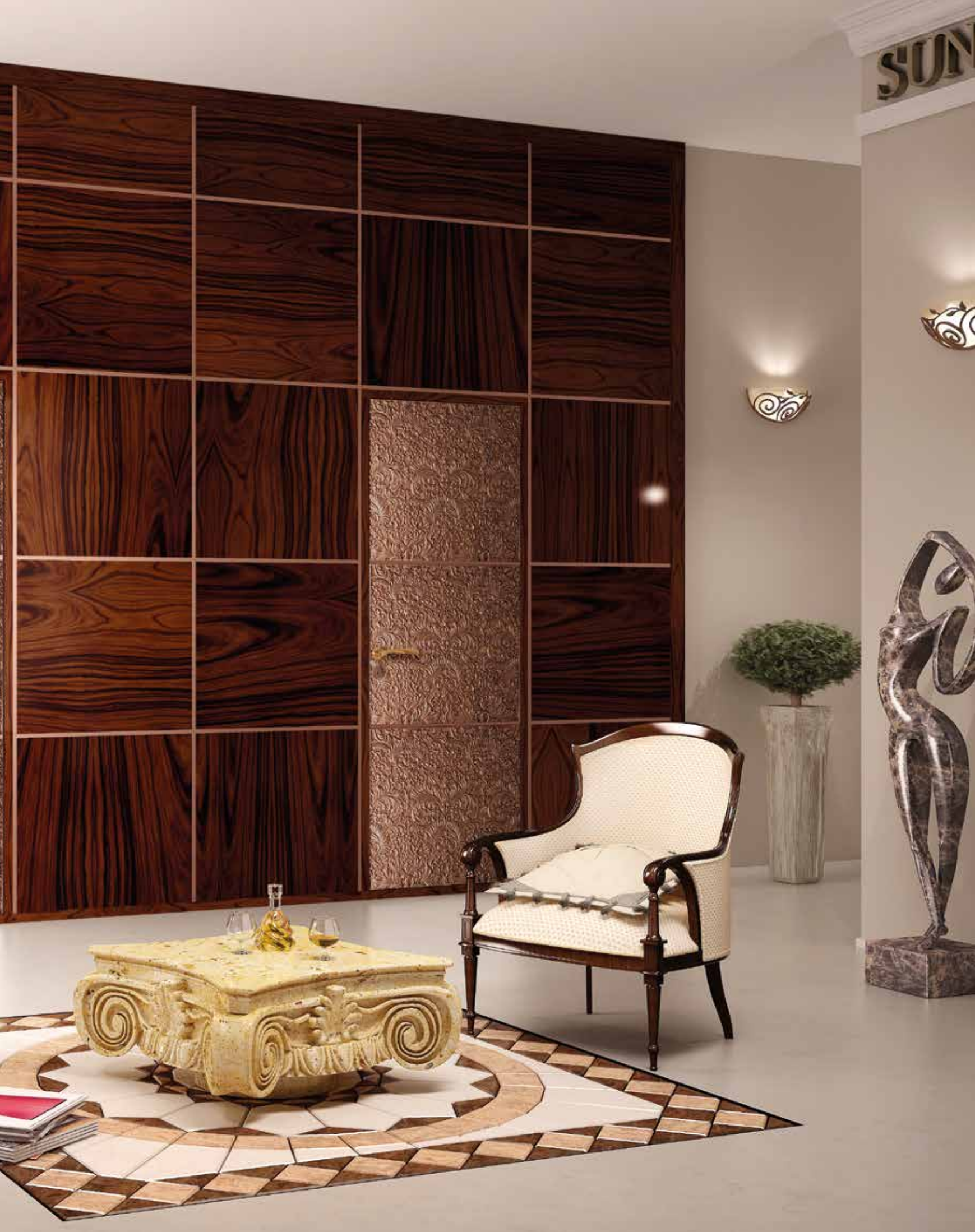
Mod. ARBAT 8025/QQ/SCi Rame lucido 100 gloss parete con boiserie palissandro lucido spazzolato