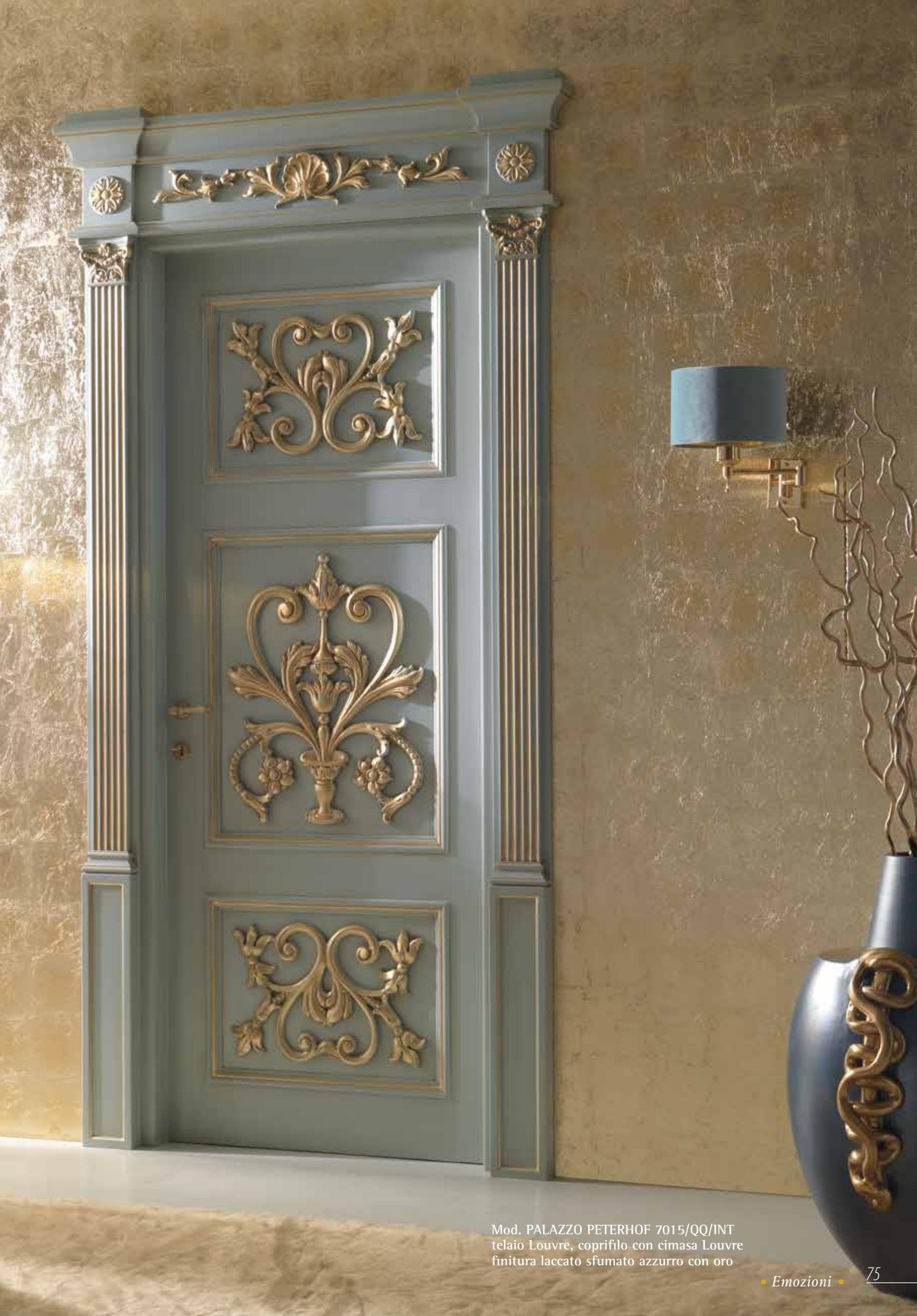
Mod. PALAZZO PETERHOF 7015/QQ/INT telaio Louvre, coprifilo con cimasa Louvre finitura laccato sfumato azzurro con oro