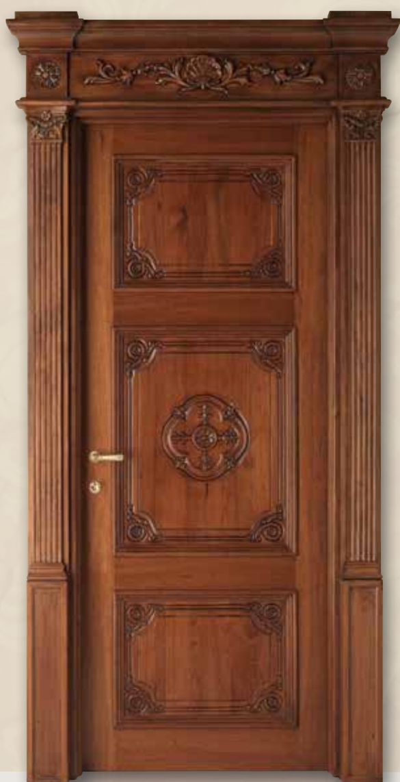
Mod. LOUVRE 8015/QQ/INT telaio Louvre, coprifilo con cimasa Louvre noce siberiano patinato