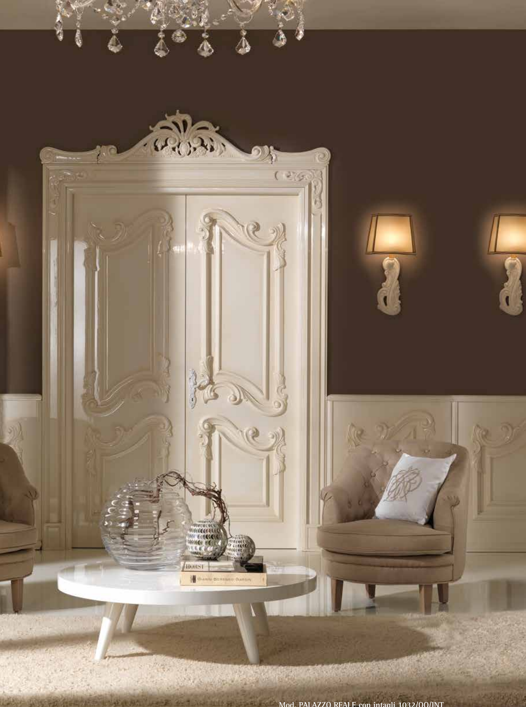
Mod. PALAZZO REALE con intagli 1032/QQ/INT coprifilo con cimasa Palazzo Reale laccato patinato lucido 100 gloss