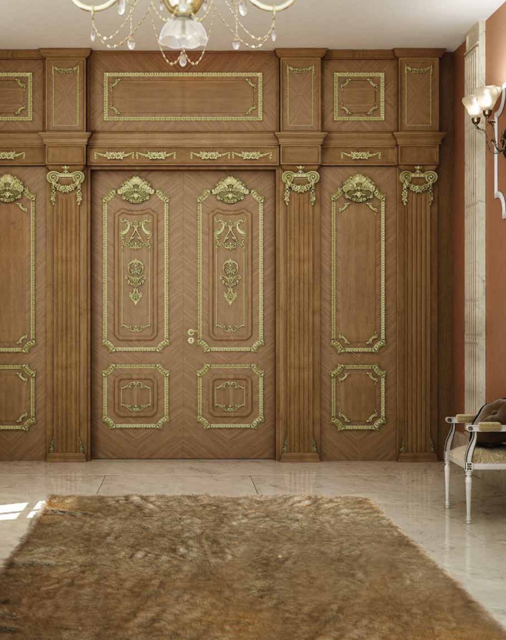
Mod. PALAZZO FARNESE 1022/QQ/INT rovere spigato coprifilo con cimasa Trianon/30, boiserie di rivestimento parete 1022/QQ