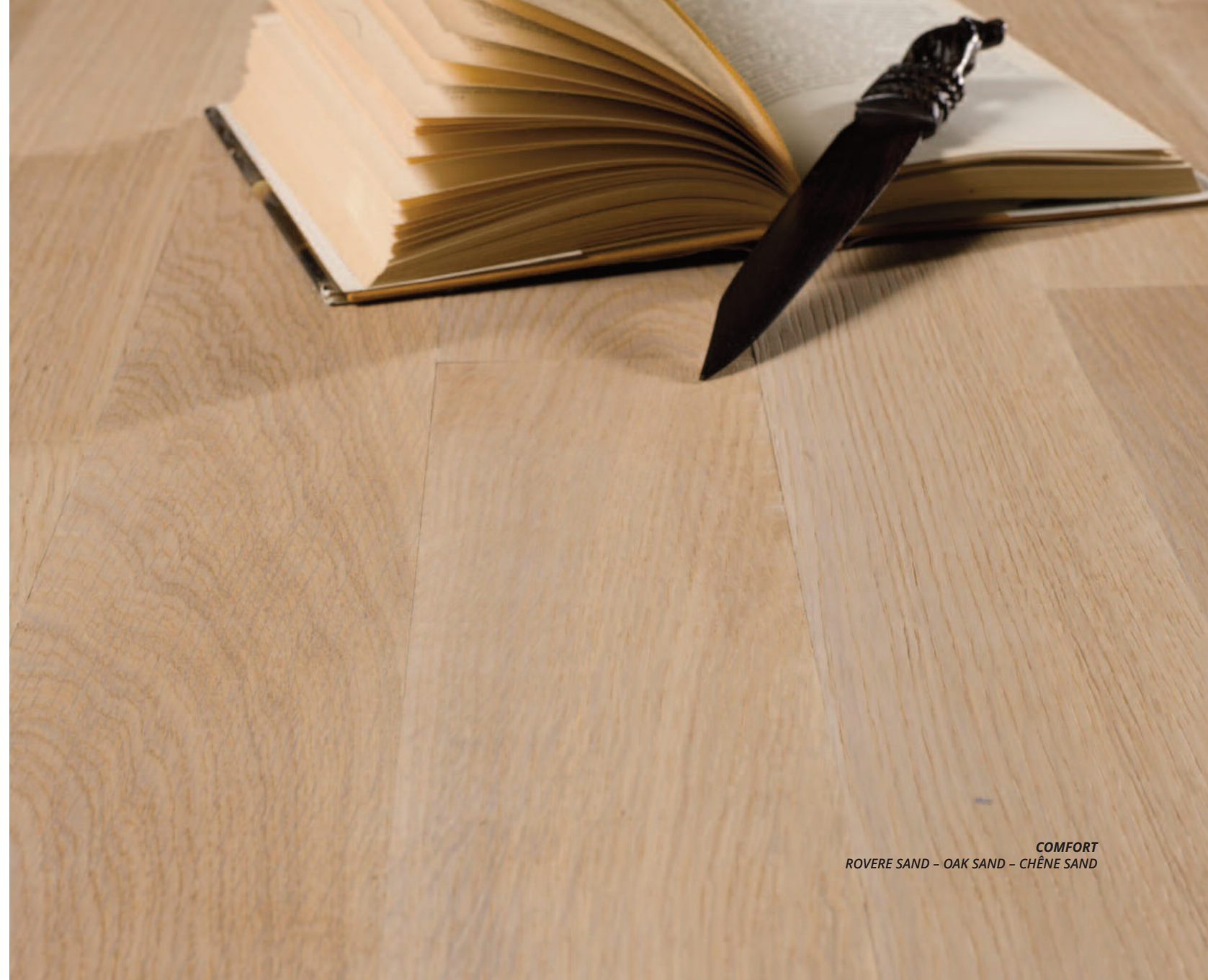
COMFORT ROVERE SAND - OAK SAND - CHÊNE SAND