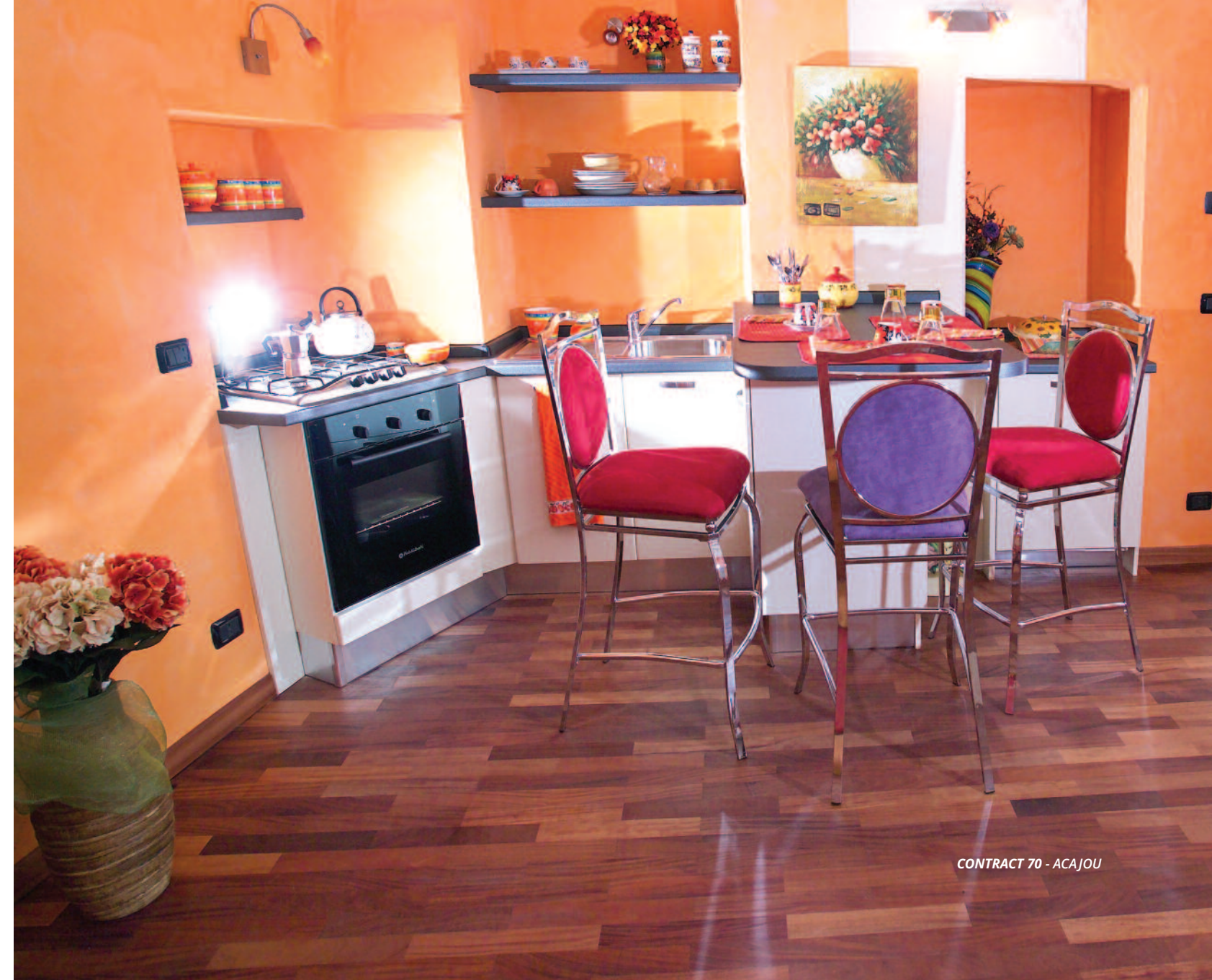
CONTRACT 70 - ACAJOU