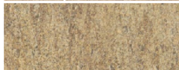
D8B8001 Antique Travertino