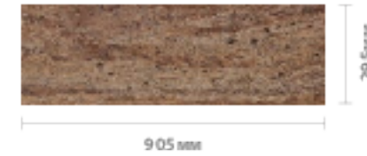
D8B7001 Antique Travertino Light