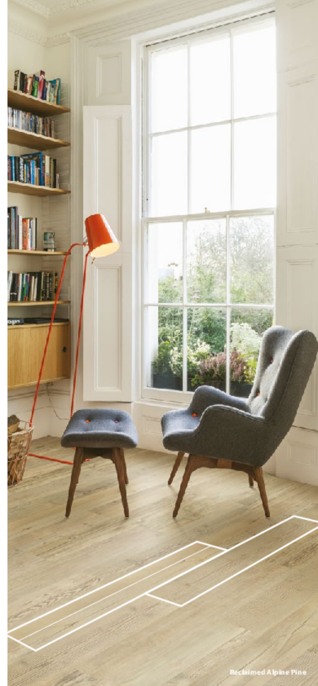
Reclaimed Alpine Pine