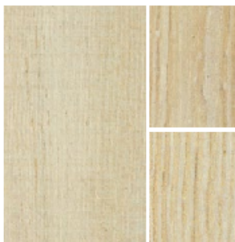
D8C3001 Reclaimed White Washed