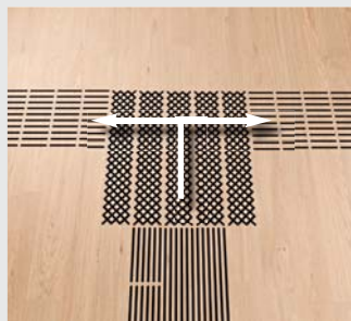
Rechts und links abbiegen