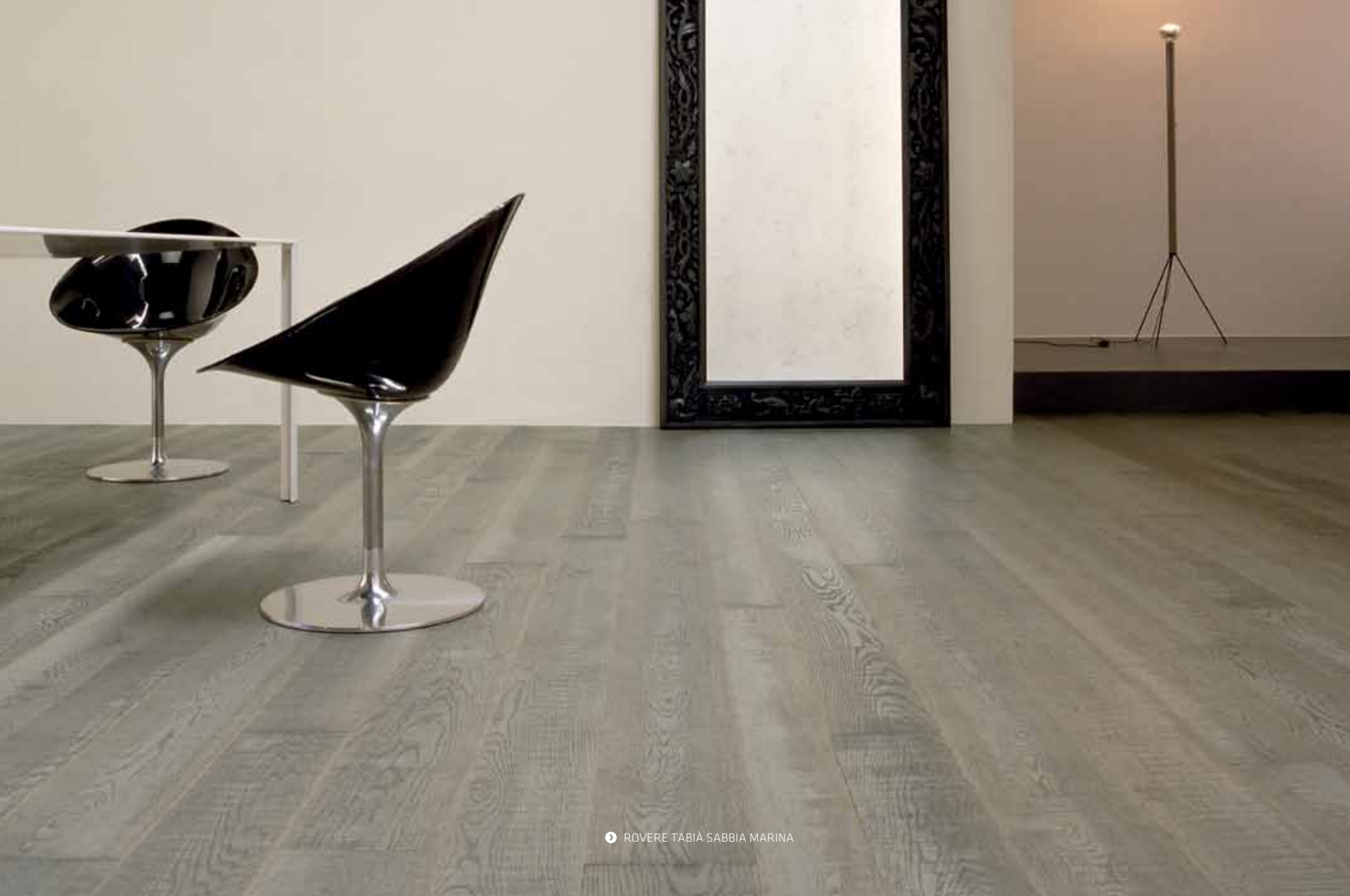
ROVERE TABIÀ SABBIA MARINA